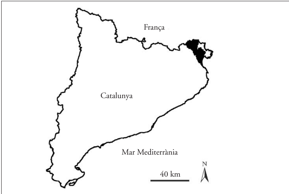
Mapa 2. Àrea d'estudi