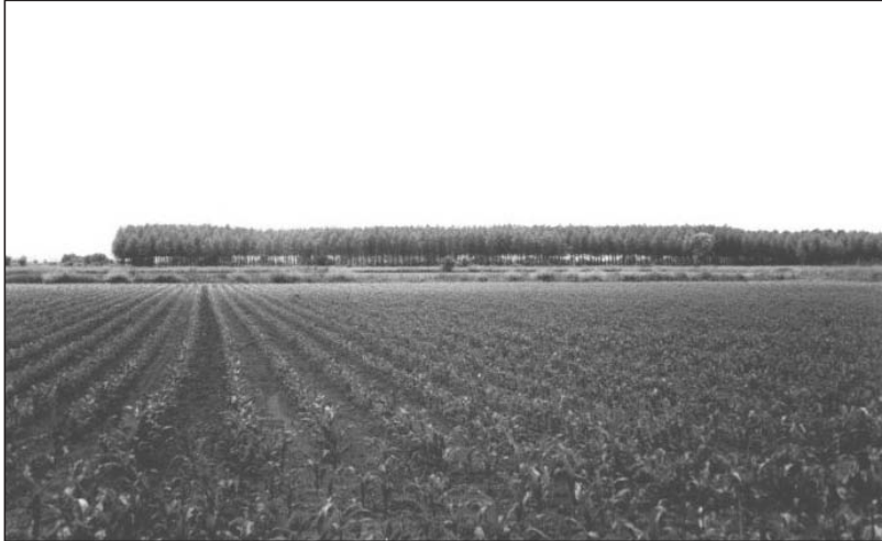
Fotografia 2 Camp d'arròs a Castelló d'Empúries (plana altempordanesa)