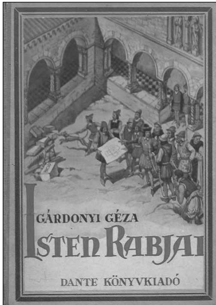
11. kép Gárdonyi Géza: Isten rabjai című regényének borítója