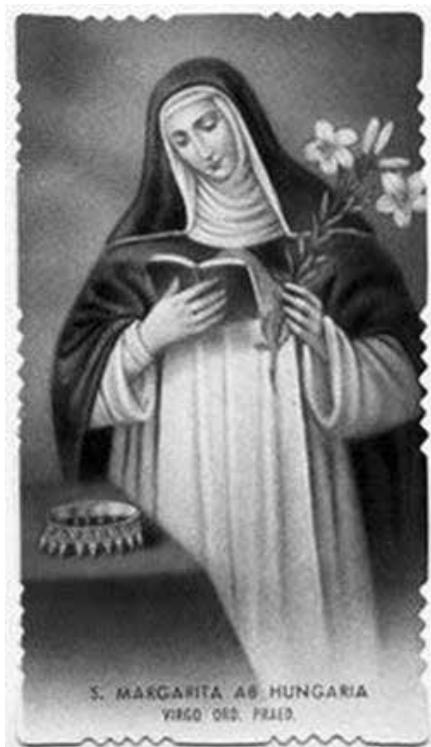
4. kép Imalap a székesfehérvári egyházmegyéből, 1943.