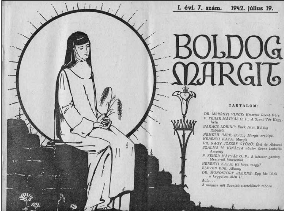
10. kép A Szegeden megjelenő Boldog Margit című folyóirat címoldala