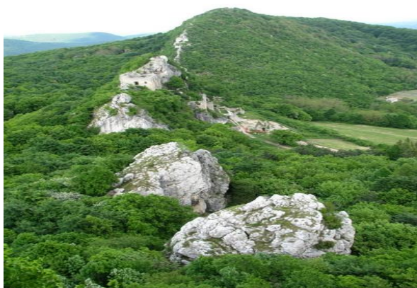
Slika 15: Staza Sedam zubi