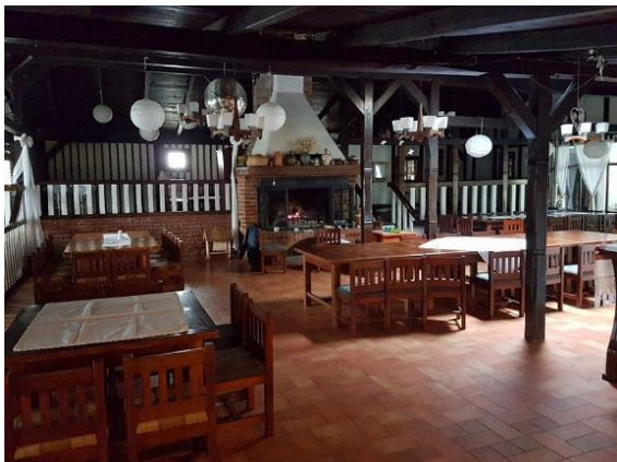
Slika 11: Restoran „Zlatni Klas“ Otrovanec Slika 12: „Zlatni Klas“ Otrovanec (dvorište)