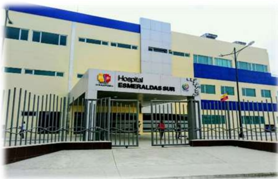
Ilustración 1. Hospital Delfina Torres De Concha Sur