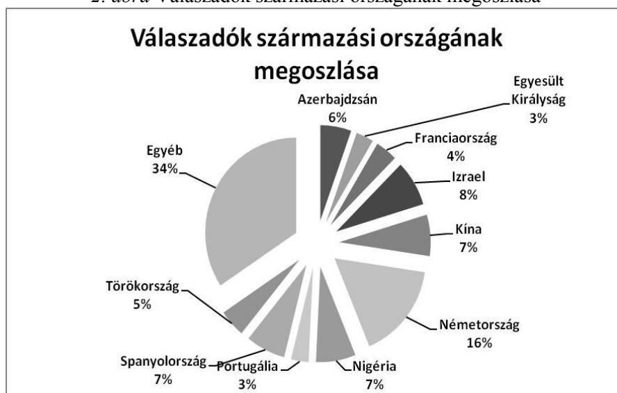
2. ábra Válaszadók származási országának megoszlása

Származási országukat tekintve a hallgatók rendkívül sok országból érkeztek Magyarországra (2. ábra). A legnagyobb arányban szerepeltek az egyéb kategóriától eltekintve a Német hallgatók szám szerint 21-en, őket követték az Izraeli hallgatók 10 kitöltővel, majd a Kínai, Nigériai és Spanyol kitöltők következtek egyaránt 9-9 kitöltéssel. Az egyéb kategóriába tartoznak azok a származási országok, ahonnan csupán egy, kettő, vagy három kitöltés érkezett. Ezek a következők: Amerikai Egyesült Államok, Ausztria, Belgium, Brazília, Bulgária, Cseh Köztársaság, Dél-Afrika, Dél-Korea, Fülöp-szigetek, Görögország, Grúzia, India, Irán, Japán, Kanada, Kenya, Lengyelország, Libanon, Líbia, Magyarország, Mauríciusz, Marokkó, Norvégia, Olaszország, Svédország, Szaúd-Arábia és Tanzánia.