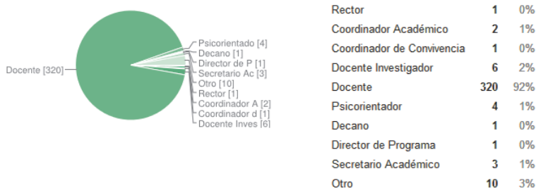
Gráfico 3. Distribución del cargo-rol que desempeñan actualmente los egresados