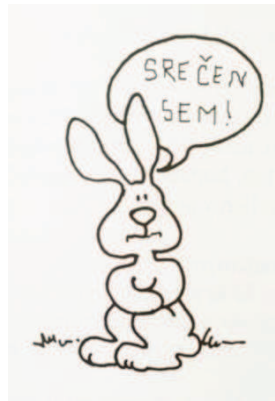
Slika 2: Neskladnost verbalne in neverbalne komunikacije (Lepičnik Vodopivec, 1996)

Da je delo pedagoškega delavca pristno, je pomembna skladnost verbalne in neverbalne komunikacije, sicer lahko v nasprotnem primeru starši dobijo mešane signale pri komunikaciji. Neverbalna komunikacija je razumljena kot videnje tistega o čemer sogovornik razmišlja, dogajanje v možganih pa izraža z govorico oči (Tomić, 1992, v Lepičnik Vodopivec, 1996). Če na primer pedagoški delavec o otroku govori pozitivno, v njegovi drži, očeh ali pa mimiki pa je razvidno drugačno mnenje, lahko starši dobijo nejasno sporočilo in postanejo nezaupljivi do pedagoškega delavca (Lepičnik Vodopivec, 1996).