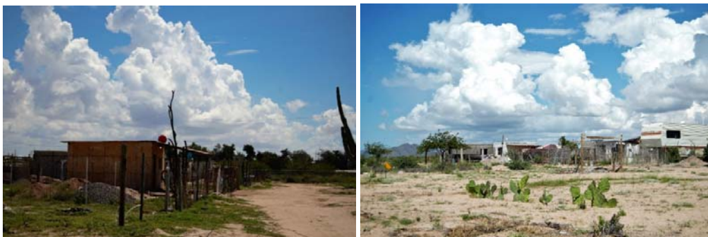
Fig. N° 3a y 3b. Viviendas de la Colonia Mediterráneo en Kino Viejo

En la imagen de la izquierda se puede apreciar el poste improvisado para soportar cables de energía eléctrica. A la derecha, la colindancia suroeste del asentamiento. Los nopales delimitan un campo de fútbol improvisado por los residentes.