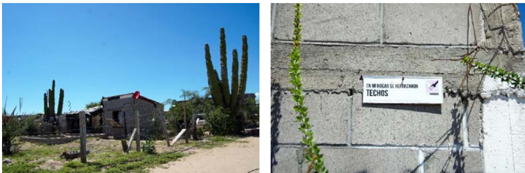
Fig. N° 7a y 7b. Cuarto construido a través del Programa para el Desarrollo de Zonas Prioritarias