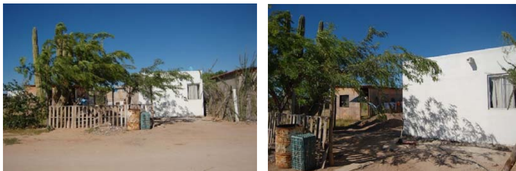
Fig. N° 8a y 8b. Cuarto rosa en Bahía de Kino Viejo

Los cuartos rosas o estrategia “Un cuarto más” de la Secretaría de Desarrollo Agrario, Territorial y Urbano (SEDATU) tienen como meta reducir las probabilidades de violencia hacia la mujer relacionado con las condiciones de hacinamiento.