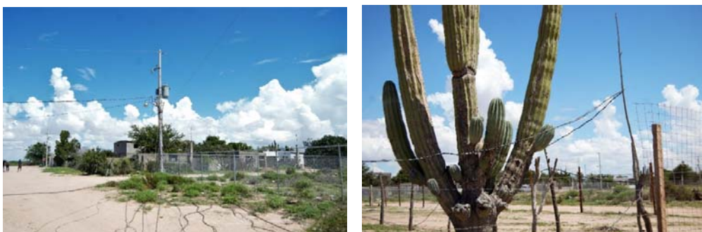
Fig. N° 4a y 4b. Suministro improvisado de energía eléctrica en la Colonia Mediterráneo

En la esquina nororiente de la Colonia Mediterráneo existen dos postes de luz. Sólo las viviendas contiguas a este suministro cuentan con un contrato, el resto de la colonia se abastece mediante cables conectados de manera irregular.