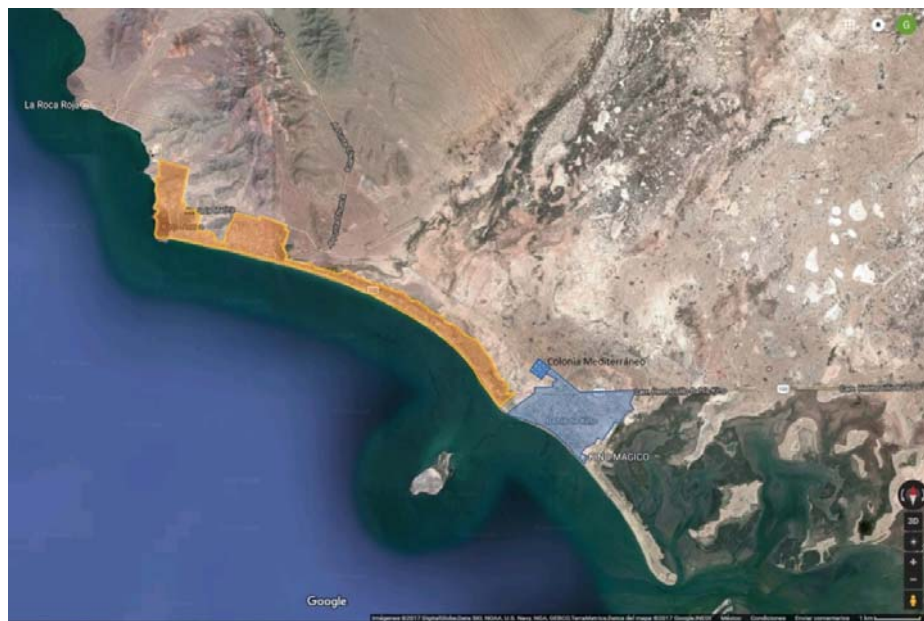
Fig. N° 2. Bahía de Kino, costa del Mar de Cortés

Bahía de Kino se asienta sobre una franja litoral de aproximadamente 18km. En la imagen se observa Kino Nuevo en naranja, Kino Viejo en azul. En el extremo norponiente se encuentra la colonia Mediterráneo, uno de los sectores con mayor cantidad de vivienda en condiciones precarias y vivienda beneficiada por programas públicos.