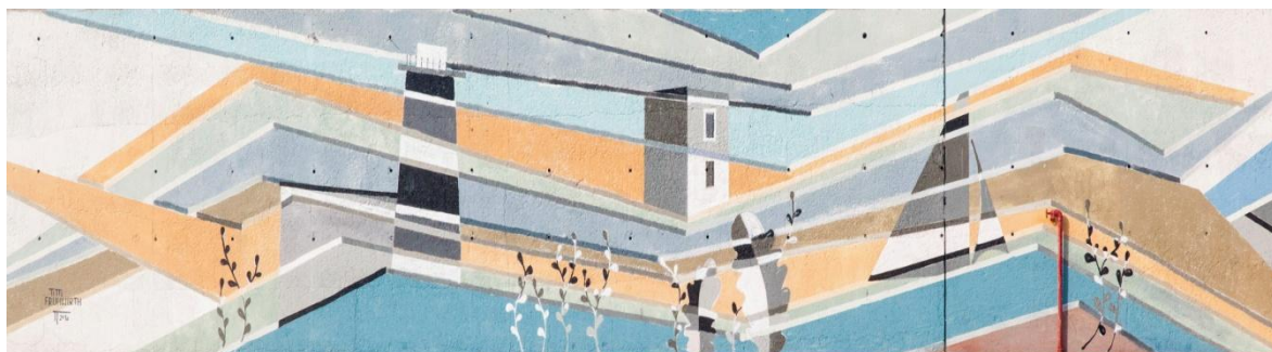
Fig. 4 – Murale sul molo ispirato al paesaggio di Ventotene.

2.3 - Le iniziative indipendenti e le buone pratiche - Dal 2015 i 370 metri di cemento grigio del molo nuovo ospitano ogni anno delle opere di street art . E' il risultato del Blue Flow, festival annuale promosso da tre giovani che mira alla: “ promozione del benessere degli abitanti, riqualificazione del porto nuovo, valorizzazione delle risorse artistiche del territorio ” (Manifesto Blue Flow, 2016: 3). I progetti artistici vengono accuratamente scelti dagli organizzatori poiché i colori e i temi devono rispettare i colori e la storia dell'isola.