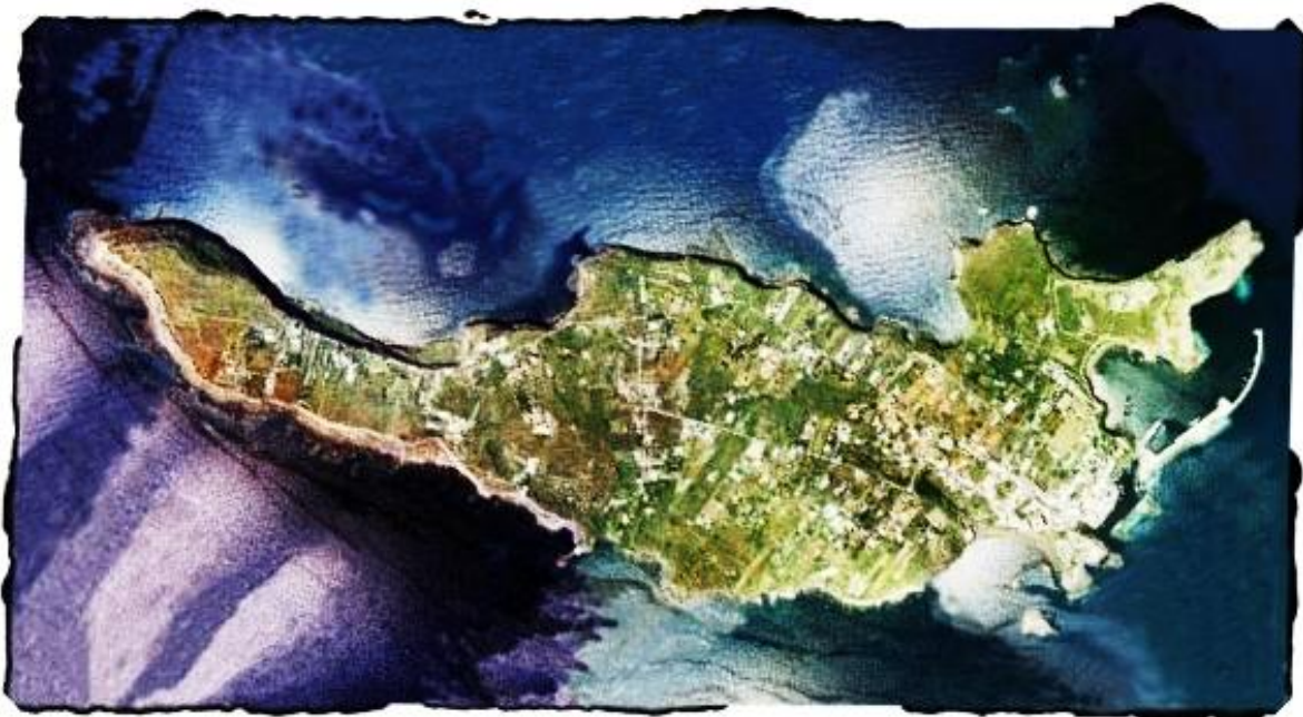
Fig. 2 – Riproduzione di una foto satellitare di Ventotene scattata nel 2014.