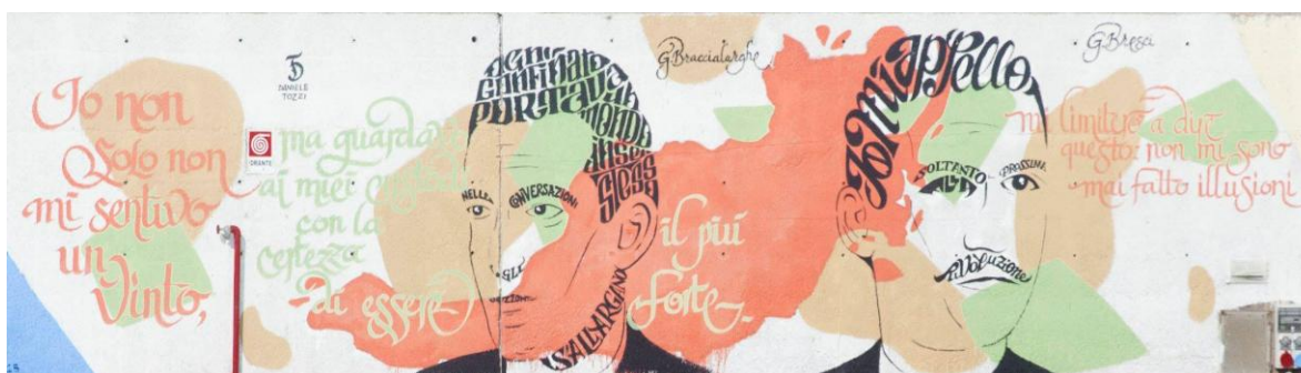
Fig. 5 – Murale sul molo raffigurante due esiliati politici del regime fascista nel carcere di Santo Stefano.

Il festival si svolge a maggio prima dell'ondata turistica. L'intenzione è quella di offrire ai ventotenesi un'attività culturale in un periodo dell'anno ancora privo di divertimenti e di risparmiare sui costi di organizzazione del festival. Lo status di “indipendenza” dell'iniziativa ne mette a dura prova la sopravvivenza poiché si alimenta di piccoli finanziamenti annuali. Di fronte alle difficoltà economiche i tre organizzatori si sono impegnati a creare una rete di collaborazione . Innanzitutto con le imprese locali, per assicurare ospitalità e ristoro agli artisti; poi con i giovani, che partecipano alla preparazione del molo; infine con i bambini, cui