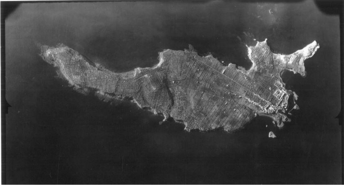
Fig. 1 – Riproduzione di una foto area di Ventotene scattata nel 1943.