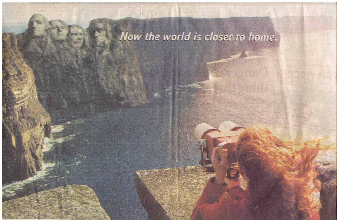
Figura 3. Re-territorializando a Irlanda