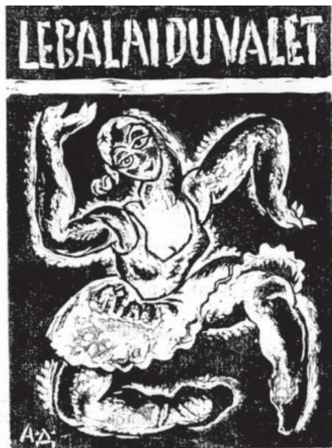
Слика 5. Плакат Александра Дерока за балет „Le balai du valet” у оквиру „Бала 1002. ноћи”