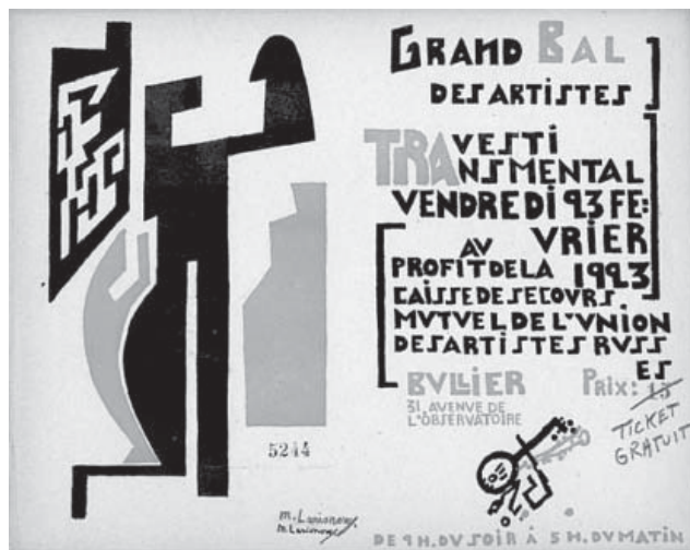
Слика 7. Улазница за „Велики Заумни бал под маскама”, дело Михаила Ларионова