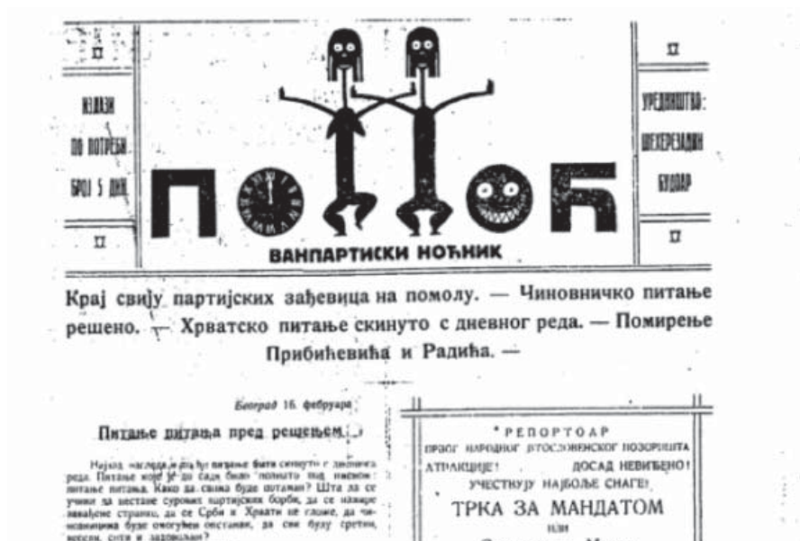
Слика 6. Насловна страна новина Поноћ , са заглављем Душана Јанковића