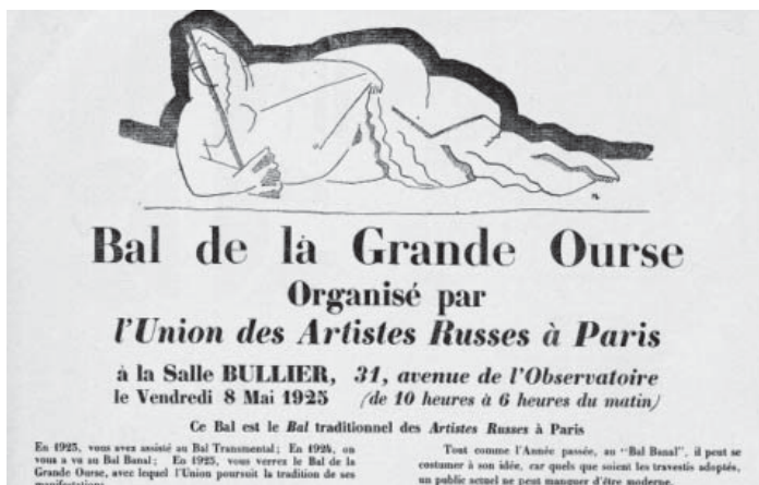
Слика 11. Плакат за „Бал Великог медведа”, Удружење руских уметника у Паризу, 1925.