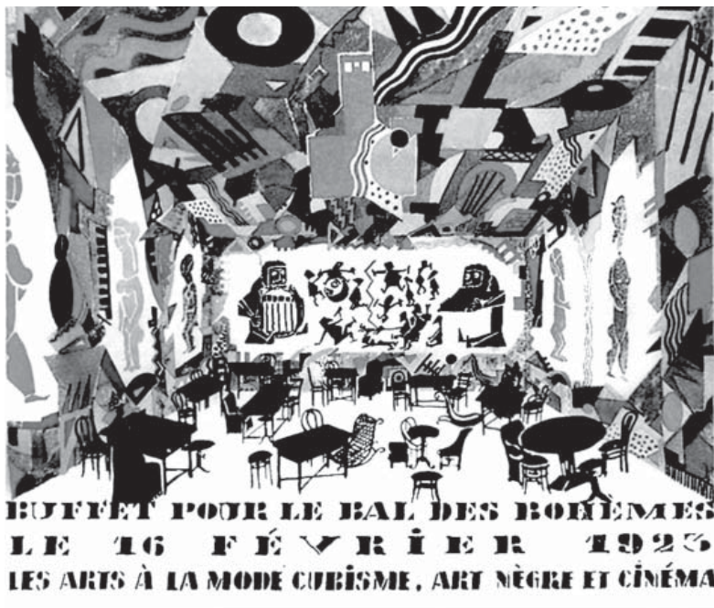
Слика 4. Плакат Душана Јанковића за „Бал 1002. ноћи”