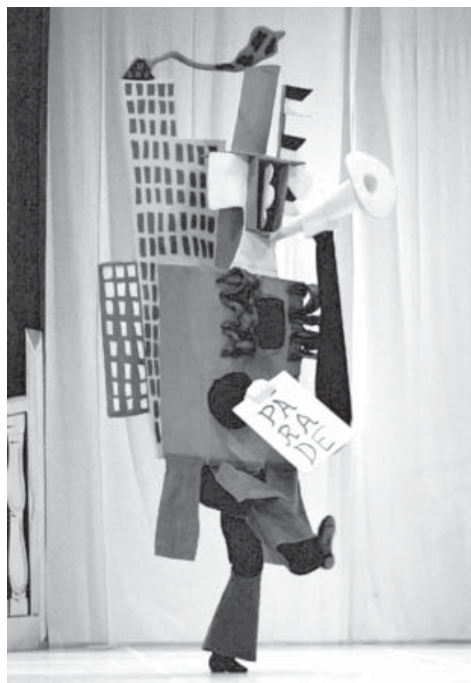
Слика 2. Костим Пабла Пикаса за балет Парада