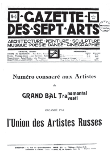
Слика 10. Насловна страна часописа La Gazette des Sept Arts Ричота Кануда посвећена „Великом Заумном балу под маскама”