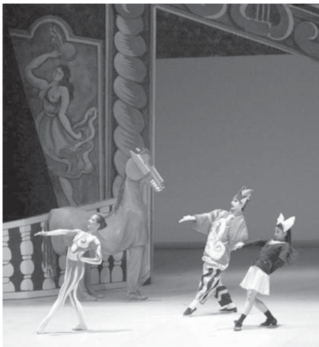
Слика 1. Балет Парада, поворка артиста