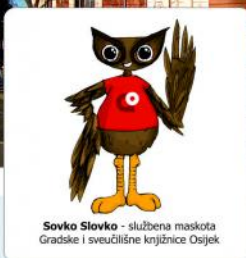
Sovko Slovko - službena maskota Gradske i sveučilišne knjižnice Osijek