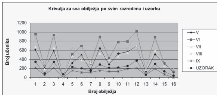
Slika 2. Prikaz svih odgovora učenika u uzorku i po razredima