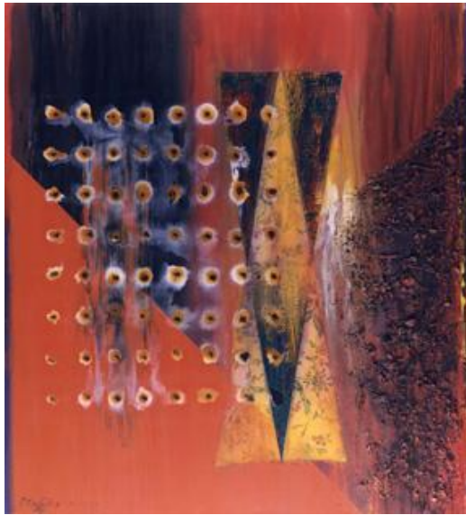
MARCANDO EL TIEMPO