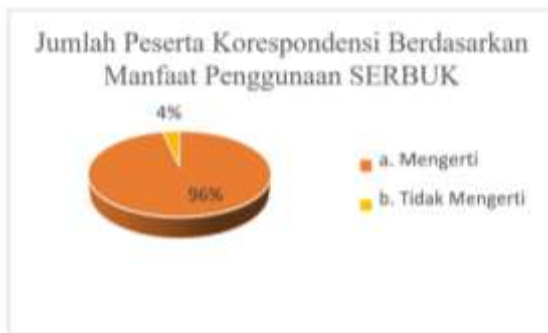
Gambar 7. Prosentase Jumlah Peserta Korespondensi Mengenai Manfaat aplikasi SERBUK