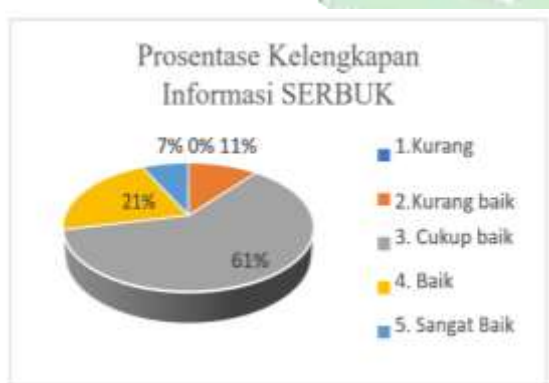
Gambar 11. Prosentase Kelengkapan Informasi

Dari data diatas, dapat dilihat bahwa dari segi kelengkapan Informasi SERBUK cukup baik, Hal ini mengindikasikan bahwa materi tersampaikan dengan cukup baik. Hal ini juga dapat dilihat dari prosentase dibawah ini.