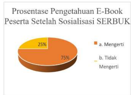
Gambar 6. Prosentase Pengetahuan E-Book Peserta Setelah Sosialisasi SERBUK