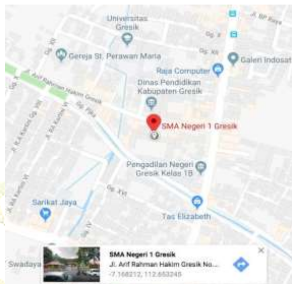
Gambar 1. Area Lokasi SMA Negeri 1 Gresik

Berdasarkan data dari google maps, lokasi SMA Negeri 1 Gresik berada pada koordinat - 7.168212,112.653245. Berikut gambar peta SMA Negeri 1 Gresik.