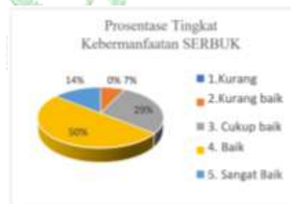
Gambar 9. Prosentase Tingkat Kebermanfaatan SERBUK

(g) Hasil lainnya yang diperoleh dari evaluasi kuisioner yang lain, antara lain mengukur tingkat kebermanfaatan aplikasi SERBUK, kelengkapan informasi mengenai aplikasi SERBUK serta pemahaman dan penggunaan aplikasi SERBUK. Hal ini dapat dilihat pada gambaran grafik datanya. Dimana untuk mengukur tingkatan tersebut dibagi menjadi 5 kategori yaitu, Sangat Baik, Baik, Cukup Baik, Kurang Baik, dan Kurang.