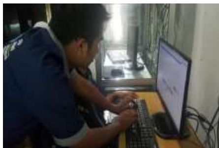
Gambar 15. Mahasiswa S1 Sistem Informasi UNUSA yang membantu dalam kegiatan PkM SERBUK dan instalasi aplikasi SERBUK.

Adapun dokumentasi kegiatan Pengabdian Masyarakat ini dapat diamati berdasarkan gambar-gambar berikut ini: