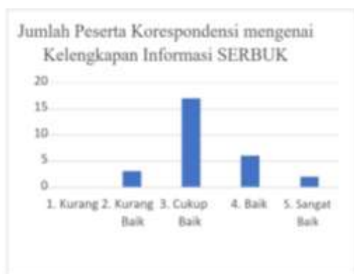
Gambar 10. Jumlah Peserta Korespondensi mengenai Kelengkapan Informasi SERBUK

Selain mengukur tingkat kebermanfaatan, pada pelaksanaan PkM ini, kami mengukur tingkat kelengkapan informasi mengenai aplikasi SERBUK yang dapat dilihat pada Gambar 10.