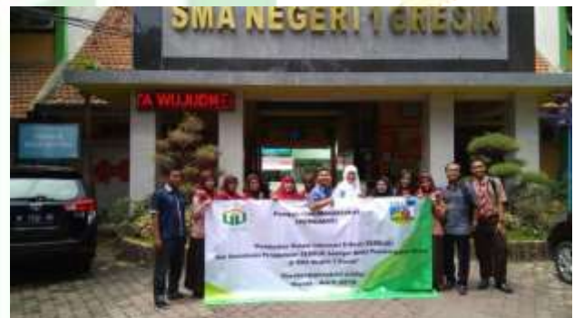
Gambar 18. Kegiatan Sosialisasi dan Praktek Penggunaan Aplikasi SERBUK