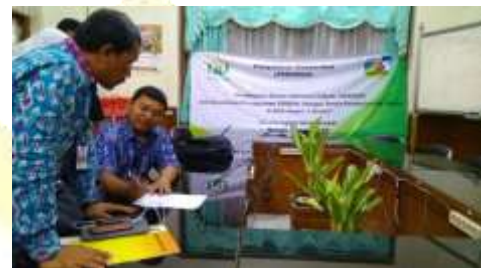
Gambar 17. Kegiatan Persiapan Sosialisasi Penggunaan Aplikasi SERBUK