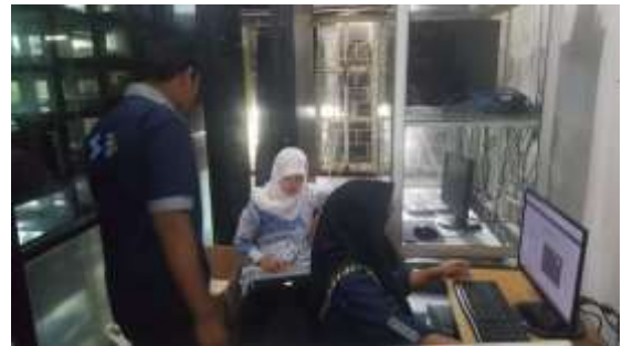
Gambar 16. Konfigurasi dan Setting Jaringan untuk Server SERBUK