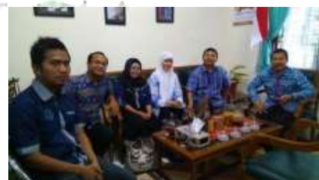
Gambar 19. Penutupan Kegiatan PkM di SMA Negeri 1 Gresik, Kabupaten Gresik.