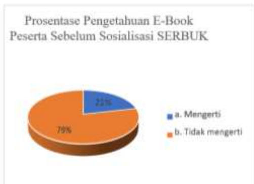
Gambar 5. Prosentase Pengetahuan E-Book Peserta Sebelum Sosialisasi SERBUK

(e) Pengetahuan peserta mengenai sharing E-Book setelah Sosialisasi SERBUK terjadi peningkatan sebesar 53.58%. Hal ini ditunjukkan pada Tabel 5 dan Gambar 6.