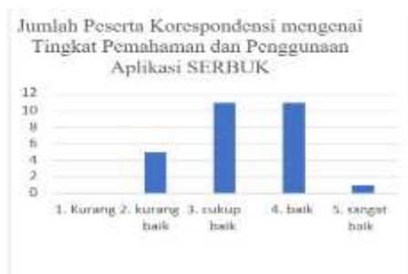
Gambar 12. Jumlah Responden mengenai Tingkat Pemahaman dan Penggunaan Aplikasi SERBUK

mengukur tingkat pemahaman dan penggunaan aplikasi SERBUK dapat dilihat pada Gambar 12.