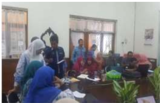
Gambar 20. Pelaksanaan Kegiatan PkM di SMA Negeri 1 Gresik