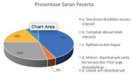
Gambar 13. Prosentase Saran Peserta

berharap kedepannya aplikasi SERBUK dibuat tampilan yang lebih menarik.