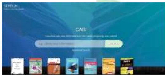
Gambar 14. Tampilan Aplikasi SERBUK

Kegiatan pengabdian masyarakat ini, masih perlu perbaikan untuk lebih baik lagi. Berikut adalah tampilan website aplikasi SERBUK yang dibuat menggunakan Open Source Senayan Library Management System (SliMS Akasia). [3][4].