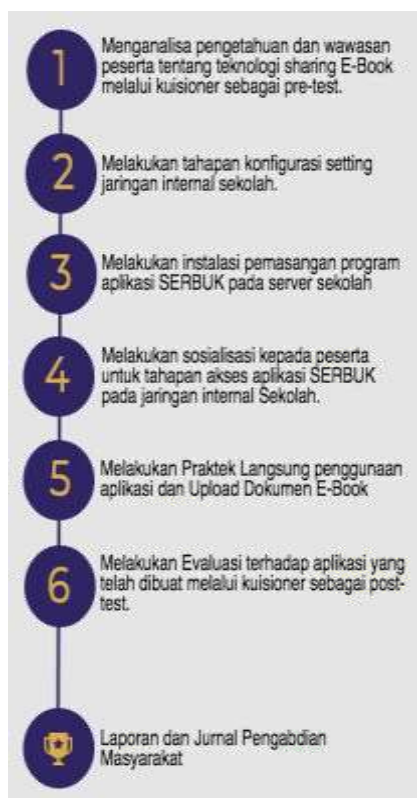
Gambar 2. Mekanisme Metode Pelaksanaan Pengabdian masyarakat

dilakukan dengan mekanisme yang ditunjukkan pada Gambar 2.