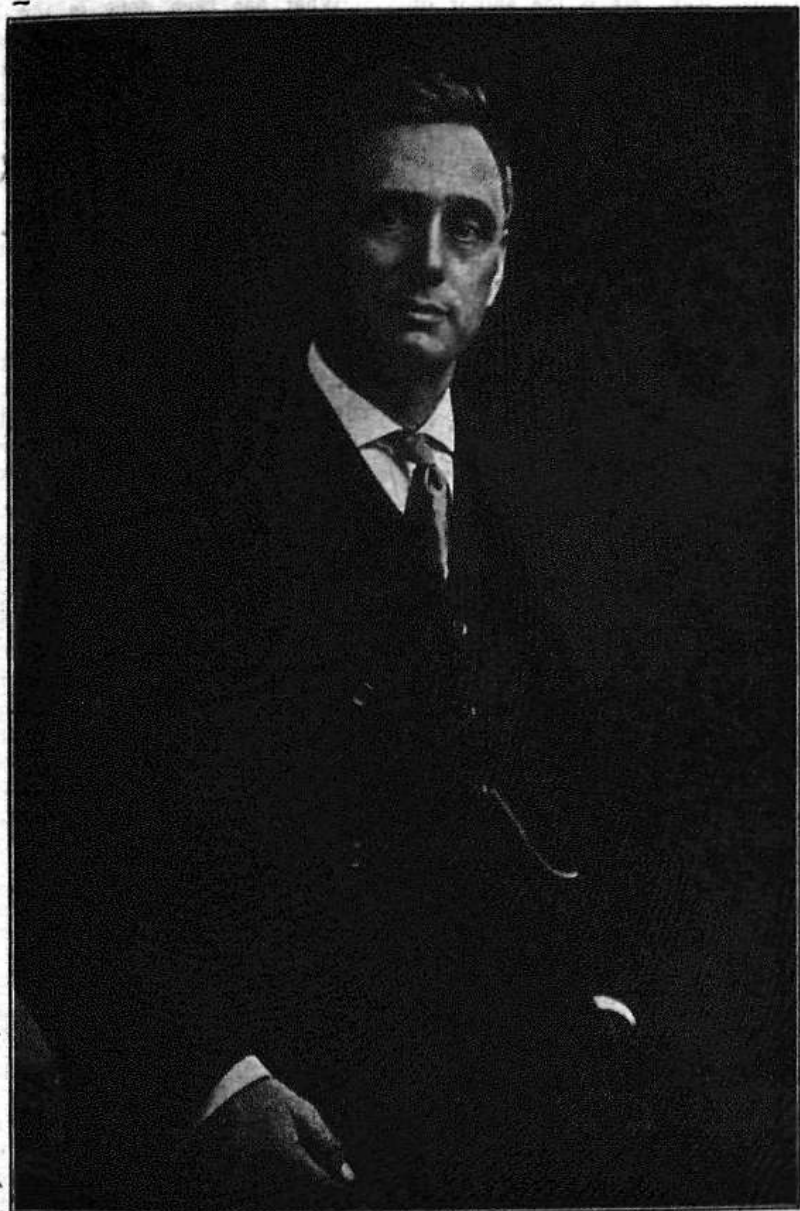
LOUIS D. BRANDEIS.

Mr. Louis D. Brandeis, Chairman of the Board of Arbitration in the cloak and suit industry in New York, was born at Louisville, Kentucky, on November 13, 1856. He received his education in the elementary and high schools of Louisville, in the Realschule of Dresden, and at Harvard.