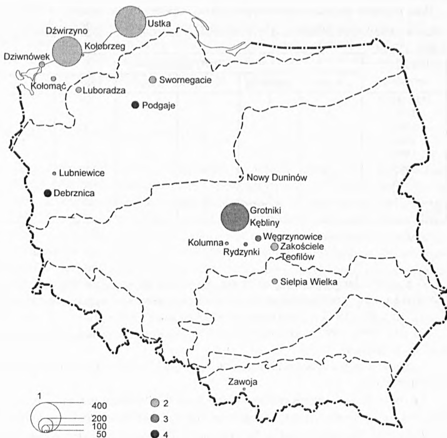
Rys. 1. Baza turystyczna zakładów przemysłu lekkiego w Łodzi w roku 1997 wg stref krajobrazowych

1 – miejsca noclegowe (powyżej 400, 200, 100, 50), 2 – ośrodki użytkowane, 3 – ośrodki nie użytkowane, 4 – ośrodki w trakcie sprzedaży (1997 r.)