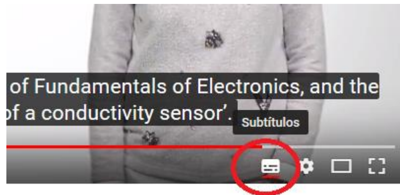
IMAGEN 2. Material empleado para la realización de la medida de conductividad

Estos vídeos se encuentran publicados en YouTube. Están grabados en castellano, y subtítulos en inglés, al cual se accede a través del icono situado en la parte inferior derecha de los vídeos (ver Imagen 2).