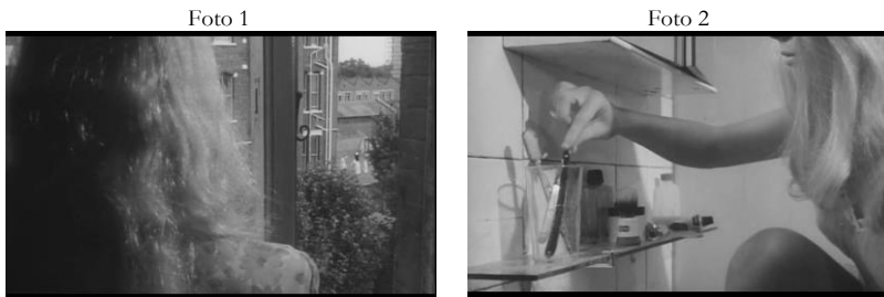
Fuente: Capturas de pantalla del DVD de «Repulsión». Edición «Fnac». Distribuidora «Avalon».

Al minuto se dirige al baño (Foto 2) –espacio en el que se «limpia» de la «realidad masculina de afuera»–, pero la navaja y otros útiles de higiene del amante de la hermana son el primer signo de invasión (masculina), dando lugar a la primera tensión repulsivo–sexual entre Carole y Michael, el amante de su hermana Helen.