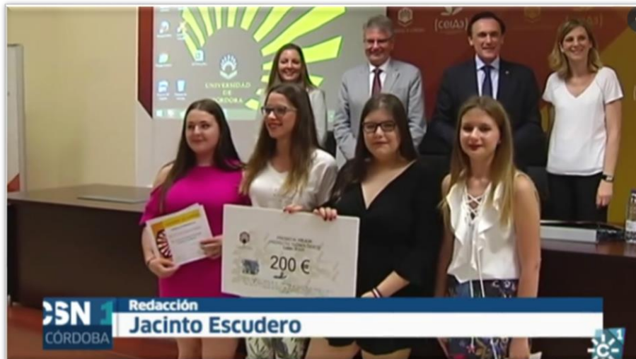
Figura 4. Entrega del Premio al equipo ganador por el Rector .