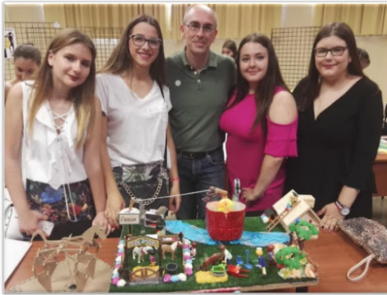
Figura 3. Equipo ganador del I.E.S. Averroes con el profesor del centro.

En la jornada todas las participantes recibieron un diploma de participación y de finalistas y/o ganadoras (Figura 5).