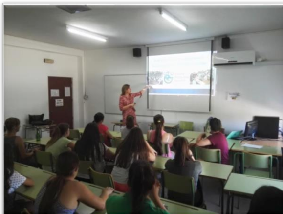
Figura 1. Impartición de una charla informativa en el IES Averroes.

En una primera etapa para evaluar el conocimiento, motivaciones y expectativas que tienen las alumnas de secundaria sobre las titulaciones de ingeniería de la Universidad de Córdoba, se han realizado encuestas en los centros que han colaborado con el proyecto (IES La Salle, IES Averroes y IES Colonial, de Fuente Palmera), a alumnas y alumnos de cursos comprendidos entre 3º de E.S.O y 2º de Bachillerato.