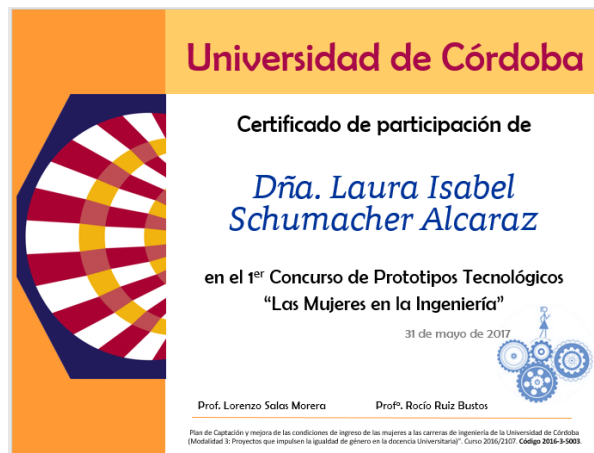
Figura 5. Ejemplo de uno de los diplomas de participación en el concurso.