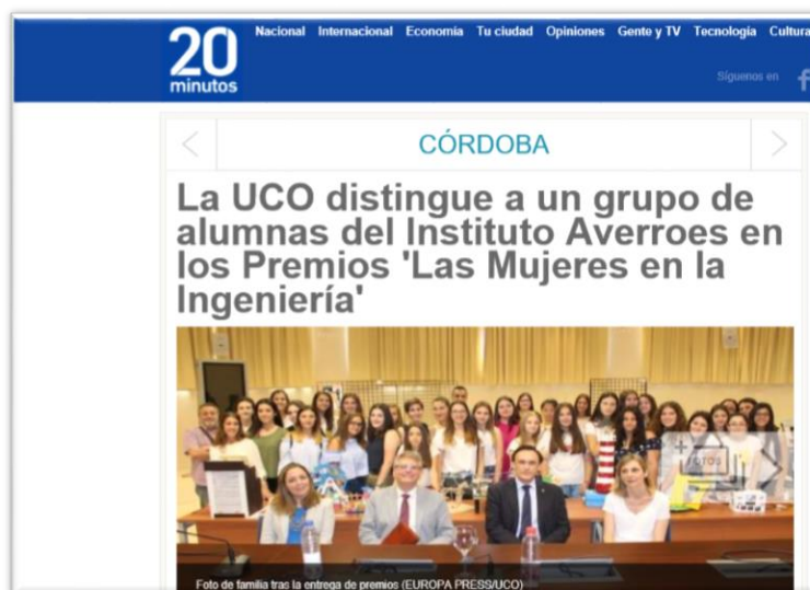
Figura 6. Publicación del concurso en el medio de difusión "20 minutos".

http://www.20minutos.es/noticia/3052286/0/uco-distingue-grupo-alumnas-instituto-averroes-premios-mujeres-ingenieria