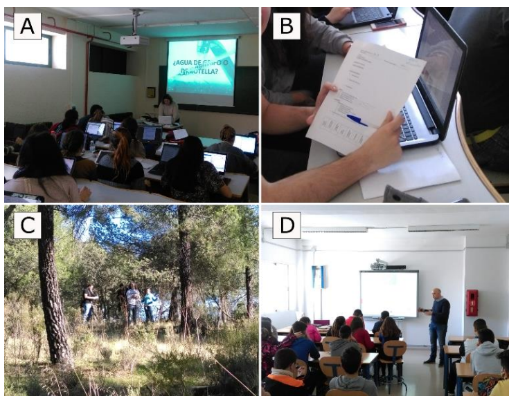
Figura 1: Sesiones expositivas de las píldoras y trabajo del alumnado. A: Sesión expositiva de la asignatura “Fundamentos de Higiene Alimentaria”. B: Detalle de la ficha de evaluación en manos de un alumno de la asignatura. C: Alumnos de “Ordenación de Montes (I)” trabajando en el monte “Terrenos Comunes de Adamuz”. D: Discusión de una píldora tras su visualización en la asignatura “Ordenación de Montes (I)”.

Las sesiones expositivas resultaron prácticas y dinámicas, con un alto grado de seguimiento por parte de los alumnos (Figura 1). Dicha observación se apoya en los comentarios y la evaluación de competencias registrados en las fichas de autoevaluación entregadas a los alumnos. En otras ocasiones se ha constatado que la aplicación didáctica de herramientas basadas en las TIC's mejora el seguimiento de las sesiones por parte del alumnado (Lucarelli, 2000). La posibilidad de realizar las píldoras informativas desde sus dispositivos móviles permitió acercar al estudiante a nuevos usos de sus teléfonos y tables; ya que estos, se han convertido en artefactos omnipresentes en la vida diaria de las personas y el explorar y explotar estos medios como potenciales recursos didácticos da lugar a nuevos conceptos o estilos de enseñanza como el “ Mobile Learning ” o Aprendizaje Móvil (Brazuelo y Gallego, 2014)