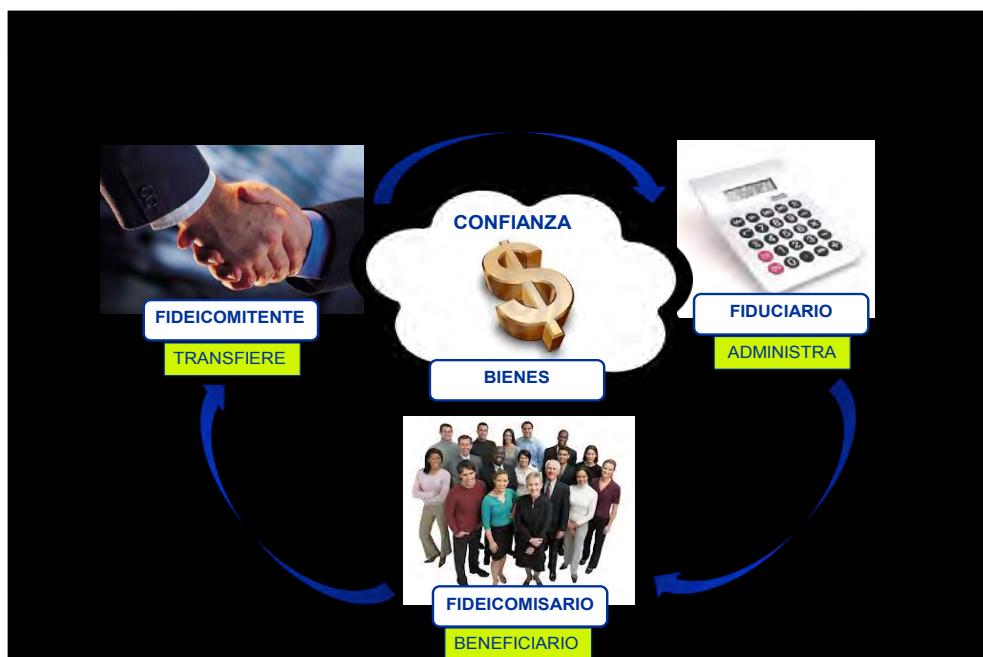
Figura 1: Estructura de un fideicomiso

En otras palabras, describiendo la imagen elaborada por nosotros, en un fideicomiso siempre debe existir un fideicomitente, que es quien transfiere sus activos (bienes, cuentas por cobrar: sus cobranzas, entre otros) a un patrimonio fideicometido, que es administrado por un fiduciario, con el objetivo de beneficiarse él mismo o de un tercero (fideicomisario).