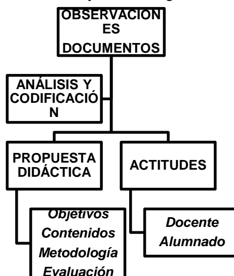
Figura 1. Esquema de codificación y análisis de los datos.

De acuerdo con Gibbs (2012), el primer paso es realizar un tratamiento de los datos para buscar, separar y extraer aquellas dimensiones y categorías que aporten luz y significado sobre el fenómeno de estudio. De esta manera, se genera conocimiento y se aportan iniciativas de cambio para su aplicación en la comunidad educativa. En la Figura 1 se muestra el proceso de codificación y análisis seguido.