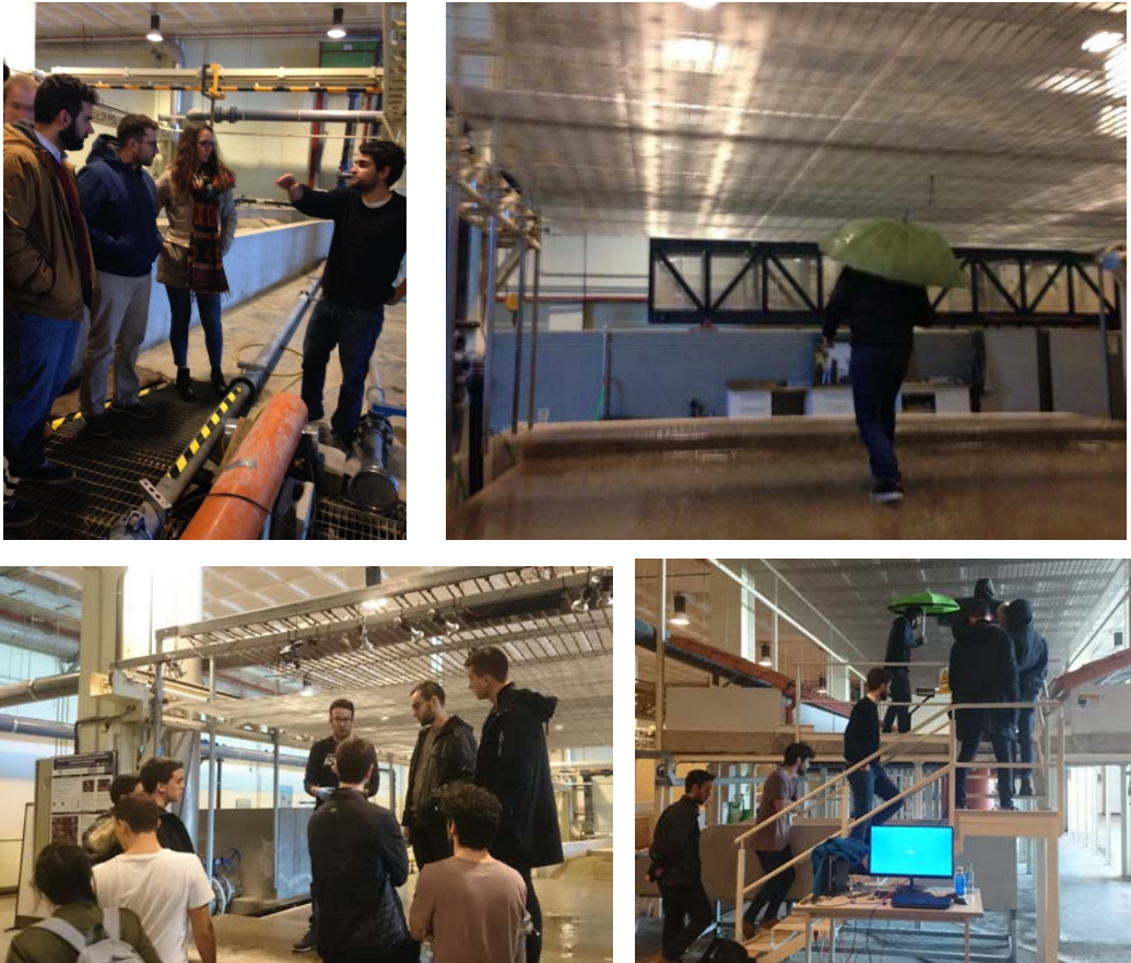
Figura 4. Fotografías de las visitas a los simuladores de lluvia.

generó un ambiente distendido en el que la participación del alumnado creció notablemente y favoreció un mejor ambiente en el aula en las siguientes sesiones.