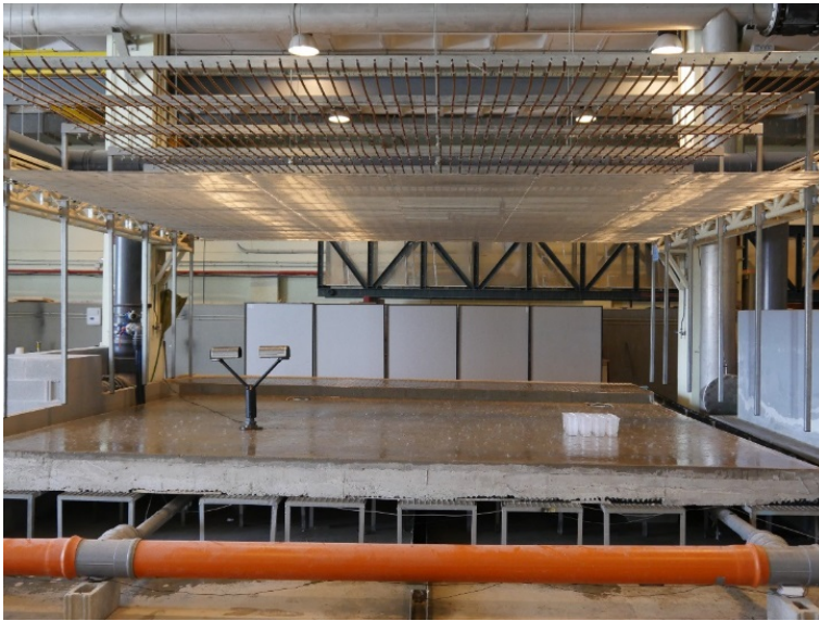
Figura 1. Modelo físico con simulador de lluvia a escala de calle en el laboratorio de hidráulica del CITEEC.