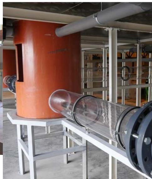
Figura 2. Modelo físico con simulador de lluvia a escala de barrio en el laboratorio de hidráulica del CITEEC.