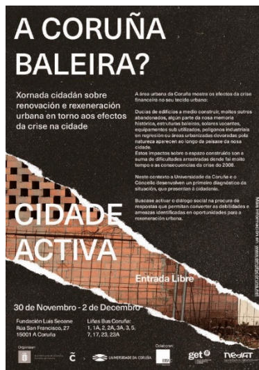
Imaxe 5. Cartaz Xornadas Cidadás

Estas xornadas acolleron en dous días conferencias e debates de diferentes expertos, así como de axentes sociais e representantes políticos da cidade. Algunhas das persoas invitadas doutras partes do estado foron Ethel Baraona Phol (Barcelona), Eva Morales (Málaga) e n´UNDO (Madrid) que expuxeron a súa visión dunha mesma problemática en diferentes partes do mundo.