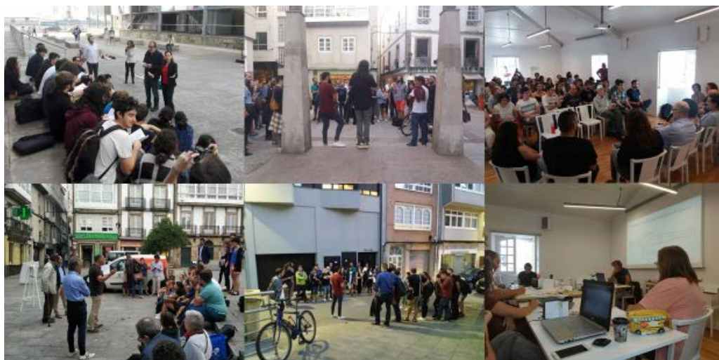
Imaxe 3. Aulas na rúa (dereita), roteiros (centro), debates e discusións (dereita)

Este curso apoiouse sobre un traballo de investigación previo, onde o profesorado implicado, xunto cun amplo grupo de alumnos e alumnas da UDC cartografaron, debuxaron e documentaron os materiais utilizados no curso de verán.