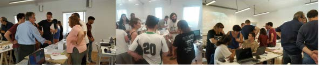
Imaxe 2. Workshop

Este workshop foi acompañado de sesións teóricas que tiveron por argumento as diversas temáticas do habitat: dereito, tecnoloxía, medio ambiente, ética, finanzas, urbanismo e deseño. Estas clases supuxeron a base teórica que lles permitiu aos grupos avanzar na investigación dos diferentes casos en relación a diferentes disciplinas.