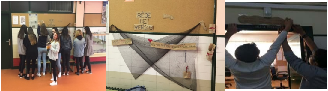
Imaxe 9. Intervención no IES Monelos.

A avaliación do proxecto foi moi satisfactoria por parte de todas as persoas implicadas. Por un lado, a da ASF que grazas ao proxecto encontrou na literatura máis un “espazo” para fomentar a vindicación do dereito ao hábitat no ámbito educativo. Por outro lado, a do alumnado de secundaria na medida en que a intervención poética fixo que -parafraseando algunhas das súas opinións- cando menos por unha tarde, este se sentise dono do seu propio espazo, un espazo educativo do que deberían sentirse parte a diario, non só pola cantidade de horas que pasan nel, senón porque del é de onde saíran eses adultos do futuro, uns adultos que queremos donos dos seus propios actos, reflexivos e críticos ante a sociedade.