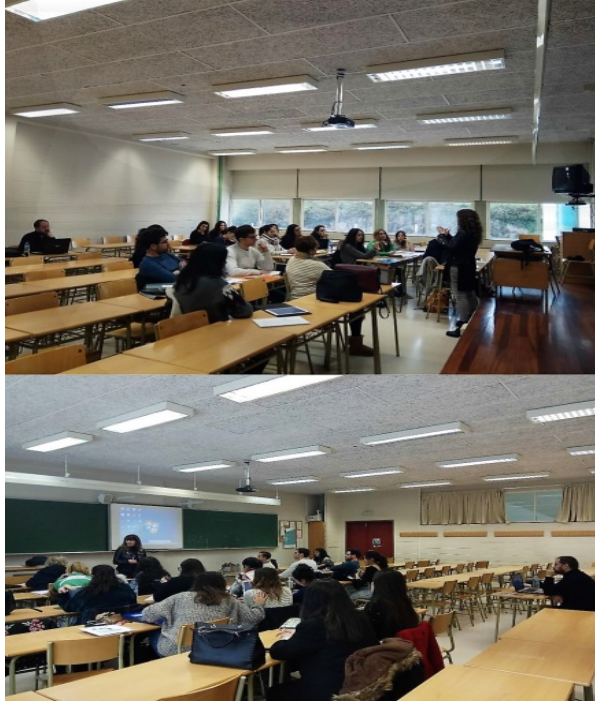
Imaxe 1. Sesión formativa: dereito ao hábitat.

preparación, implementación e avaliación, mentres que o resto das persoas participantes tan só foron axentes activos nas dúas últimas.