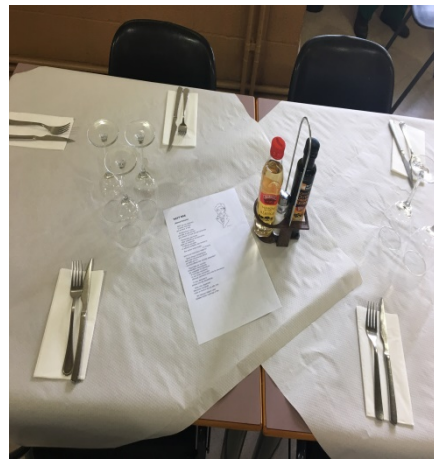
Imaxe 7. Intervención na Fac. de CC. da Educación.

Desde a perspectiva de formación docente, a intervención fixo tamén que o alumnado do mestrado experimentase como destinatario a complexidade da programación e da execución dunha actividade destas características, para poder planificar con acerto e anticiparse aos posibles obstáculos, xa como docentes e guías, na intervención poética no IES Monelos co alumnado de 3º da ESO e na súa posterior actividade profesional. As restricións de tempo e as dificultades creativas foron as limitacións para as que o noso alumnado artellou diversas