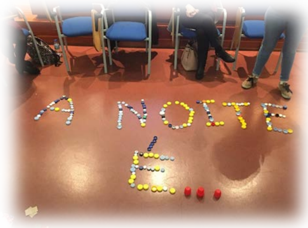
Imaxe 5. Arte efémera e poesía.

estratexias para traballar o xénero poético dentro e fóra das aulas, mais tamén nos involucrou no propio proceso creativo e, entre todos, fomos quen de crear un poema colaborativo denominado “A noite é...” (Imaxe 5).