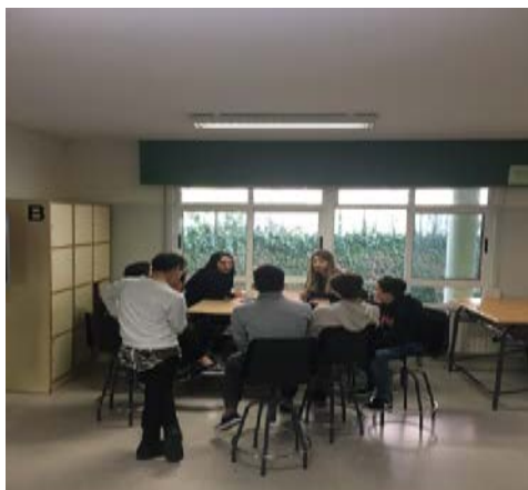
Imaxe 8. Alumnado do mestrado e de secundaria preparando as intervencións.

estratexias. Neste punto, é preciso indicar que, tratándose de alumnado adolescente e tendo en conta que a actividade proposta se escapaba do que se considera “tradicional”, a actividade foi coordinada polo noso alumnado de xeito exemplar e a participación do alumnado de secundaria foi activa e creativa ao 100% sen que se producise ningún momento de “descontrol” ou “apatía” por parte do alumnado de secundaria (Imaxe 8).