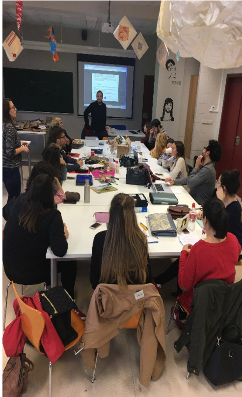
Imaxe 3. Laboratorio creativo.

A fase de preparación comezou xusto a seguir do obradoiro e consta tamén de dúas actividades principais: a primeira, un laboratorio creativo en que, aplicando o aprendido, se esbozaron diversas ideas para realizar unha intervención poética nos espazos comúns da facultade de Ciencias da Educación; e, a segunda, a propia intervención (Imaxe 3). O alumnado acordou deseñar un conxunto de artefactos que, colocados en diferentes lugares de traballo e de paso, convidasen ao goce, á reflexión e mesmo á participación. Así, para as persoas que transiten por eses espazos as diferentes intervencións exercerán simultaneamente un desafío e un convite: “un desafío porque cuestionan os seus comportamentos ensimesmados e rutineiros. Un convite porque posibilitan a participación da cidadanía en actos