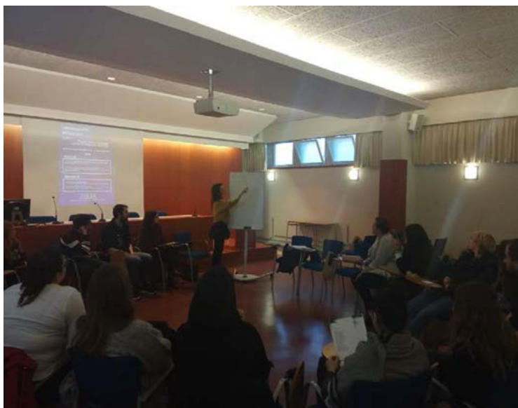
Imaxe 2. Obradoiro impartido por Yolanda Castaño.

que en nada favorece o gusto pola lectura, e máis particularmente, pola poesía. A respecto da marxinalización do xénero poético no ensino-aprendizaxe da literatura, tamén se posiciona Abril Villalba (2004), que sinala carencias formativas e que alude á necesidade de contar con docentes que dispoñan das calidades de afecto , humanidade , civismo e coñecementos , pois son imprescindíbeis para abordar o ensino da poesía con garantías. Neste sentido, pareceunos especialmente necesario complementar a formación didáctica do noso alumnado no tocante a este xénero literario, de modo que foi organizado un obradoiro de poesía creativa, impartido pola poeta Yolanda Castaño (Imaxe 2), para os dotar de estratexias e recursos para levar a poesía ás aulas e fóra delas dunha forma natural, mais ao tempo motivadora, divertida, subversiva e crítica. A poeta reivindicou na súa lección maxistral a poesía como experiencia e tamén as súas posibilidades de socialización e de lectura compartida, superando calquera forma de redución da súa lectura á lectura silenciosa e intransferíbel, aínda que esta tamén sexa posíbel e desexábel; demostrou, noutras palabras, que “la lectura de la poesía es performance , actuación, como, en definitiva, también lo es una clase en el aula” (Bombini e Lomas, 2016, p. 6).