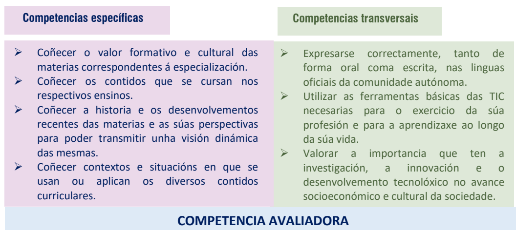
Figura 2. Competencias