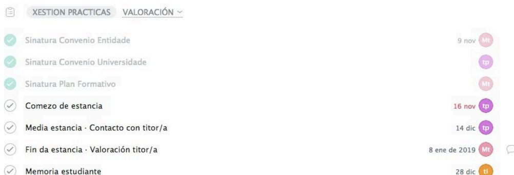
Imaxe 1. Espazo de estudante na aplicación coas subtarefas diversos estados de xestión. Na columna da dereita sinálanse a data de finalización e os responsables da mesma

Así, no espazo dedicado a cada estudante [tarefa] intégranse pasos como sinatura do convenio pola entidade, sinatura de convenio pola UDC, plan formativo, comezo da estadía, metade da estadía, fin da estadía/avaliación titor e memoria final do estudante.