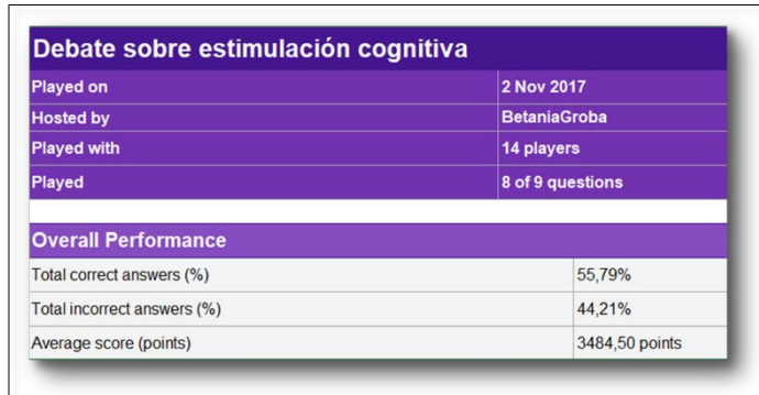
Imaxe 4: Cuantificación dos resultados de participación no Kahoot, aplicada na Universidade Senior

Nesta experiencia observouse unha maior motivación do alumnado para participar activamente nas clases.