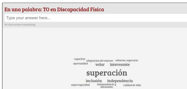
Imaxe 3: Resultados do emprego de AnswerGarden na materia de Adulto I