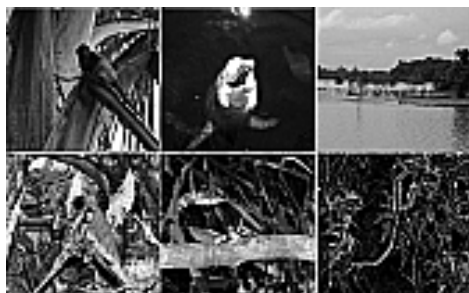
Figura 8: Espécies da fauna.

Cerca de 500 espécies de peixes (surubins, filhotes, pacus e pirarucus (Figura 9) dentre outros) comuns e diversas espécies de animais como botos, antas, jaguatiricas, jacarés, preguiças, morcegos, macacos e cobras completam o ecossistema lacustre e fluvial, que preserva, ainda, espécies ameaçadas de extinção, como o peixe-boi e a ariranha.