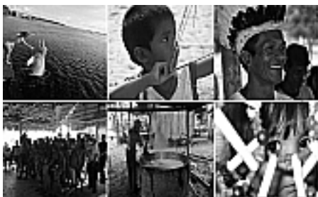
Figura 11: Moradores Tradicionais.

Sabe-se que a ocupação humana tem sido vista como um problema para a preservação ambiental, portanto, é fundamental realizar discussões e ações de desenvolvimento, articuladas à educação e conservação ambiental, com a população local, pois estes também devem propor soluções para produção ou programas de geração de renda.