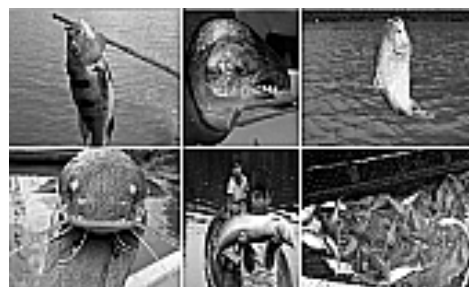
Figura 9: Variedades de peixes.

A metodologia adotada baseia-se na modalidade pesquisa-ação participante de cunho qualitativo, por meio de consultas bibliográficas e visita de campo in loco na área de entorno dos municípios limítrofes