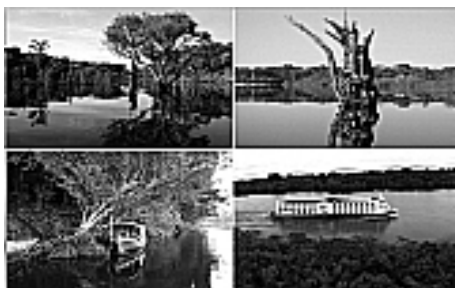
Figura 3: Inúmeros igarapés, paranás, canais.

Possui, além de inúmeros igarapés também área de terra firme, paranás e vários canais entre as ilhas (Figura 3), navegáveis por barcos de grande porte.