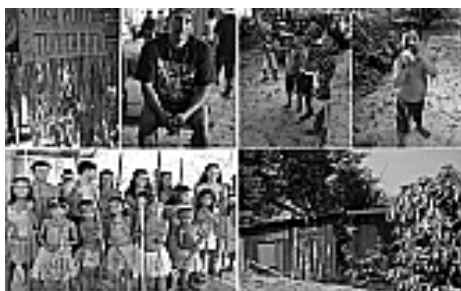
Figura 5: Comunidades de Anavilhanas.

Assim, as práticas de Educação Ambiental buscam esclarecer e conscientizar as comunidades sobre as necessidades de mudança de atitude frente à degradação dos ecossistemas e desvalorização das minorias.