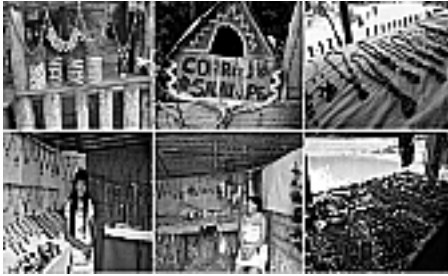
Figura 10: Artesanato tradicionais.

Desta feita conclui-se que se faz necessário uma reflexão sobre a relação, turismo, desenvolvimento econômico, sustentabilidade, educação e conservação ambiental, como solução para a ocupação humana dos moradores tradicionais (Figura 11) do Parque Nacional de Anavilhanas refletidas na inter-relação entre a sociedade e seu ambiente.