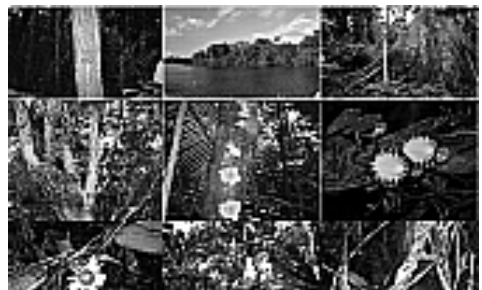
Figura 7: Espécies da flora.

As árvores chamadas de emergentes são aquelas que se destacam das outras por serem bem maiores que a maioria. Entre elas destacam-se a Samaúma, a Castanheira, o Mogno e o Angelim (CUNHA, 2013) e a fauna são bastante rica (Figura 8), além de uma variedade de insetos, aves garças, gaviões, araras, papagaios, tucanos e bacuraus. A maior parte da fauna é composta por animais que habitam as copas das árvores, entre 30 e 50 metros de altura.