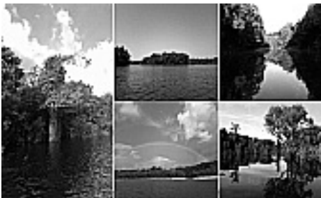
Figura 6: Igarapés.

A área do arquipélago de Anavilhanas encontra-se incluída no Programa de Proteção da Biodiversidade do Amazonas, criado através do Decreto nº 86.061 de 02.06.1981 na categoria de Estação Ecológica de Anavilhanas, localizada no Estado do Amazonas, Municípios de Manaus, Airão e Novo Airão, composta de 03 (três) áreas no total de 350.018 ha (trezentos e cinquenta mil e dezoito hectares). Através da Lei nº 11.799 de 29.10.2008 a Estação Ecológica de Anavilhanas foi recategorizada para Parque Nacional de Anavilhanas.