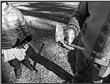
Fotografia 10 – Resineiro e raspadeira