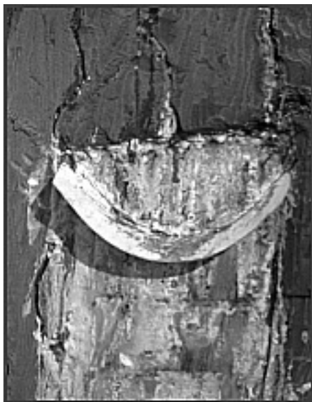
Fotografia 2 – Bica colocada no caule

Com a ajuda do mete bicas e do maço, o resineiro colocou e fixou, com um prego, a bica ao caule do pinheiro, na parte de baixo da zona que acabou de se preparar (fotografia 2).