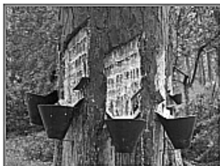
Fotografia 4 – Montagem das bicas em torno do caule

de 10cm entre si, maximizando a recolha de resina (fotografias 4).