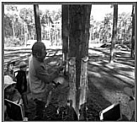
Fotografia 5 – Pinheiro com 6 púcaros, 4 dos quais visíveis

da resina nos púcaros, sendo que alguns já tinham uma quantidade considerável desta substância (fotografia 6).