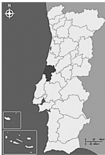
Figura 1 – Mapa de Portugal e localização do distrito de Leiria.

Nos séculos XIII e XIV, no reinado de D. Afonso III e de D. Dinis, é plantado o Pinhal de Leiria com o objetivo de impedir o avanço das areias e fornecer madeira para a construção de embarcações utilizadas no comércio externo, expandido por D. Dinis. Durante a época dos Descobrimientos Portugueses, o Pinhal de Leiria ganha particular importância, uma vez que dele se