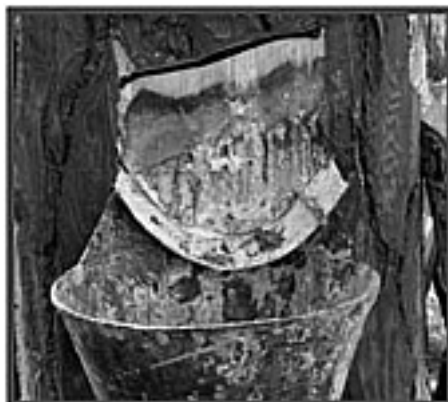
Fotografia 3 – Bica e púcaro inseridos no pinheiro

Os cortes são feitos em volta do caule do pinheiro com um espaçamento de cerca