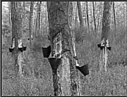
Fotografia 9 – Vista geral do pinhal

Por fim, os bidões são transportados para as fábricas com a finalidade da resina ser destilada.