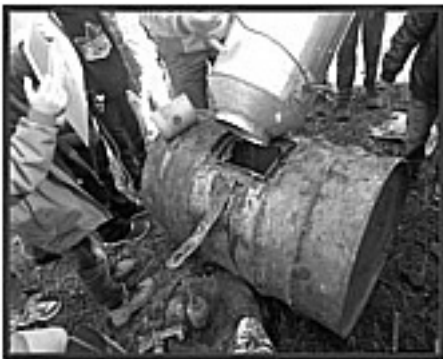
Fotografia 11 – Simulação da colha

A destilação é feita na indústria de primeira transformação e tem como objetivo separar a aguarrás que fica em estado líquido, do pez que fica em estado sólido. Cada um destes materiais terá ainda que ser sujeito a uma segunda transformação (indústria de segunda transformação) para poderem fazer parte de uma série de materiais distintos. De acordo com o ICNF (2000), nesta data haveria em Portugal seis indústrias de primeira transformação, cinco indústrias de segunda transformação e três empresas de comércio e extração de resina na mata.