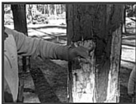
Fotografia 1 – Descarrasque

Inicialmente, o resineiro com a “descarrasadeira” (cortante) retirou uma porção de casca do caule do pinheiro, onde vai ser feita a chamada ferida (fotografia 1).