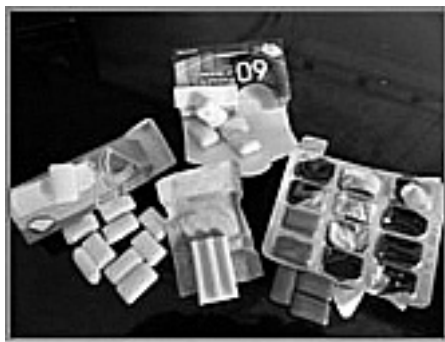
Fotografia 7 – Materiais/objetos produzidos a partir da resina

produtos de limpeza, sabão, perfumes, cremes, gomas, cola, pastilhas, adesivos, elásticos, entre outros (fotografias 7 e 8).