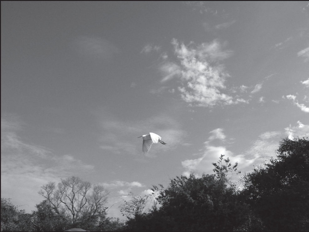
Garceta na Transpantaneira (Cuiabá-Brasil)