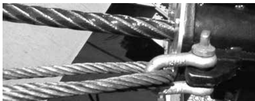
Ilustración 2. Síntomas de aplastamento

As propiedades dos cables sometidos a aplastamentos diminúen pola acción da tracción, de xeito que cumprirá evitalos.