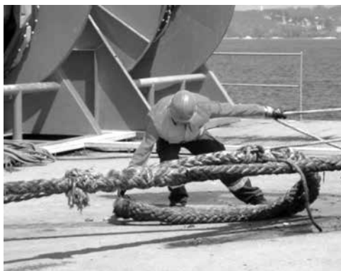
Ilustración 6. A presenza de operarios próximos a liñas de amarre tensadas debe evitarse todo o posible

As roturas de amarras sometidas a tensión caracterízanse pola liberación súbita da enerxía que almacenan en forma de esforzo –a tracción almacenada na liña de amarre–, o que en inglés se coñece como snap back . A consecuencia desta liberación é un movemento rápido e imprevisible dos dous extremos da amarra que quedaron soltos. É dicir, prodúcese un retroceso dos dous extremos desde o punto de rotura.