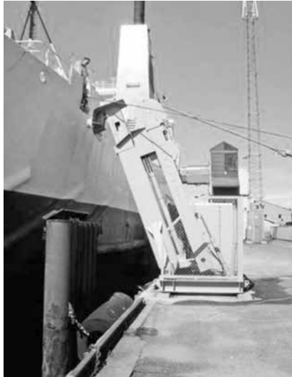
Ilustración 8. Amarre semiautomático