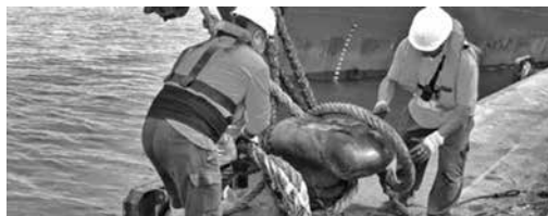
Ilustración 3. Operarios manexando os cables de amarre dun buque

Por regra xeral, o manexo de liñas de amarre sometidas a tensión require a máxima precaución por parte do persoal asignado á manobra, dadas as grandes cargas soportadas polas estachas. Nas proximidades dos puntos extremos –os chicotes– dunha estacha en tensión, os mariñeiros deberán manterse a certa distancia de seguridade para previr calquera incidencia que poida ocorrer, como por exemplo sufrir un lategazo pola rotura dunha amarra ou o ser arrastrados ao ser largada unha liña de amarre repentinamente. Así mesmo, o manexo das amarras nas máquinas de amarre esixe que non se manteñan firmes un período de tempo excesivo nos extremos do tambor da máquina. O ritmo de manexo debe ser lento e continuo no momento de cobrar as amarras. No tocante á protección das amarras fronte ao rozamento, conséguese mediante un bo mantemento dos roletes de amarre. O mesmo sucede nos extremos de cabiróns, cuxa superficie debe ser o máis lisa e regular posible.