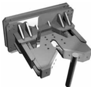
Ilustración 9. Exemplo de mecanismo electro-hidráulico de amarre automático

O concepto é moi sinxelo. No peirao, un sistema hidráulico acciona uns ganchos que se fincan en firme nalgún tipo de elemento adaptado para tal efecto a bordo do buque. Trátase dunha trincaxe mediante sistema electro-hidráulico. Ao non se contar coa flexibilidade das amarras e a absorción de tensións, o sistema deberá contar cos elementos amortecedores necesarios.