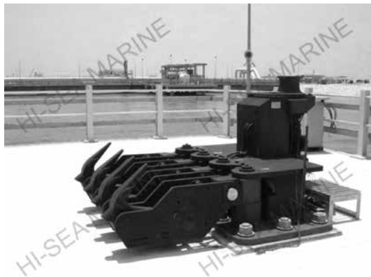
Ilustración 10. Exemplo de sistema de liberación rápida

A innovación redúcese aquí a un sistema de largado rápido ligado a un sistema de amarre convencional, cunha modificación do punto de amarre en terra, de tal forma que se substitúe a bita por un mecanismo que permite liberar as amarras sen necesidade de que o persoal interveña. Xa que logo, é válido para calquera buque. Ademais da súa sinxeleza e instalación económica, aforra tempo e esforzo ao levantar áncora o buque. Uns ganchos fabricados en aceiro forxado serven de punto de amarre. Están articulados na súa base e o seu movemento contrólao un dispositivo eléctrico que os desbloquea, de forma que baixan e nada impide á amarra quedar libre e poder ser cobrada desde o buque.