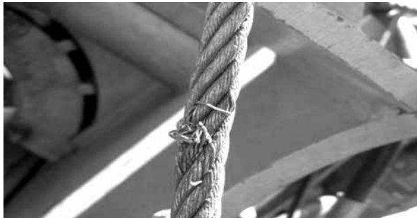
Ilustración 5. Cable de aceiro coas súas fibras exteriores rotas

En caso de desgastes, o grao do desgaste determinará se a amarra ten que ser descartada do servizo. A perda diametral máxima permisible varía, segundo as normativas, entre o 6% e o 10% do diámetro orixinal.