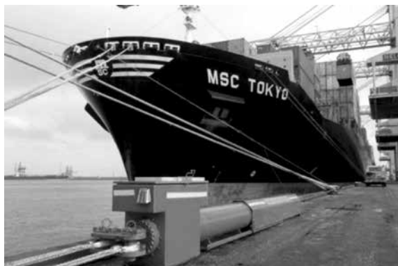
Ilustración 7. Sistema de amarre hidráulico no porto de Rotterdam