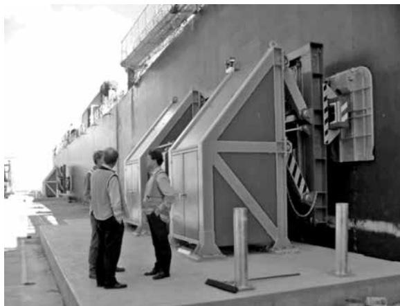
Ilustración 12. Buque amarrado por sistema de baleiro