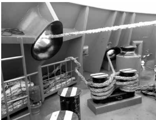
Ilustración 1. Curvatura das formas da guía

As liñas de amarre vense sometidas mentres traballan a determinados ángulos que poden comportar riscos debido ás elevadas tensións a que se encontran. Á hora de dimensionar aqueles elementos auxiliares da manobra de amarre dun buque, tales como guías e bitas, así como os equipos, tales como cabrestantes e máquinas de amarre, deben terse en conta os ángulos que formarán as liñas de amarre cos citados elementos e os raios de curvatura.