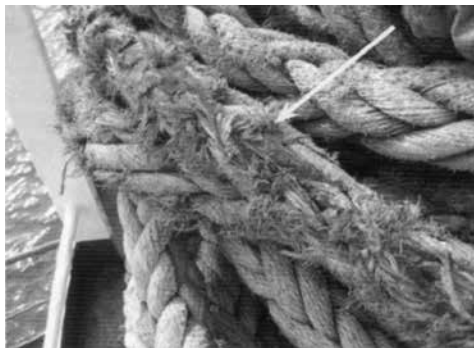
Ilustración 4. Cabo de fibra sintética con signos de desgaste