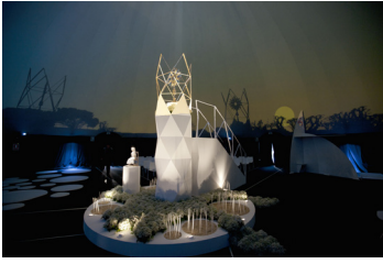
Fig. 01. Imagen de la obra "El Faro".