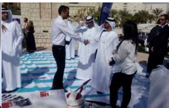
Imagen 2: Comitivas durante la Cumbre de Gobiernos

El retorno a España fue igualmente espectacular.... Fueron semanas de presentaciones, asistencias a actos y eventos, participaciones en conferencias y congresos de todo tipo, donde el proyecto de Dronlife iba consiguiendo despertar cada vez un mayor interés. Prueba de ello son los más de 150 impactos mediáticos en prensa, radio y televisión que al cabo de un año logro alcanzar el proyecto, y que se recogen en las referencias de este artículo.