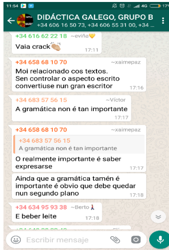
Imaxe 1. Exemplo de reflexión sobre a materia

Ao mesmo tempo, esta forma de encarar o proceso de ensino-aprendizaxe ao ser abordado desde unha linguaxe –a dixital– e un soporte –as TIC– que tamén é o seu e onde se sente cómodo, fomenta o interese do alumnado pola materia, o que se desprende do alto grao de participación e de achegas a través do grupo. Sirva como exemplo a imaxe 2, que constitúe o inicio dunha conversa que se iniciou logo de que unha alumna colgase unha foto dun panel que contiña un poema en lingua galega un día en que os incendios asolagaron a Galiza. O contido do texto (“Lonxe de ti miña terra teño que marchar mais nos teus verdes montes espero cedo despertar...”) fixo que axiña comezasen a interaxir entre eles sobre o que estaba a acontecer; así, unha conversa que comezou na tarde dun domingo prolongouse até a madrugada do día seguinte e permitiu contabilizar máis de 200 intervencións.