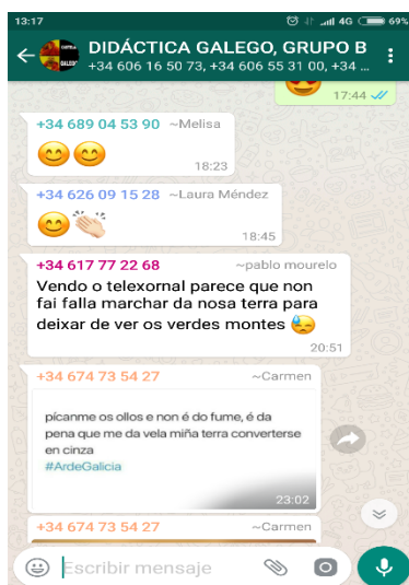
Imaxe 2. Mostra do grao de participación

Neste sentido, o propio desenvolvemento da dinámica permite ao alumnado analizar as posibilidades que a nivel metodolóxico presenta o uso das TIC no ensino-aprendizaxe dunha lingua e, en particular da galega, non só desde unha perspectiva tecnolóxica, mais fundamentalmente didáctica: por un lado, porque a distancia entre os participantes – especialmente entre alumnado e docente– e o modo en que se produce a comunicación facilita a participación ás persoas máis introvertidas que non sobresaen nas interaccións presenciais (Vázquez Simarro 2016:195); e por outro lado, porque a propia participación no grupo concede ao alumnado máis un foro en que desenvolver e mellorar a súa competencia lingüística, tanto a través da autocorrección como da retroalimentación dos seus iguais e/ou da docente, como se observa na imaxe 3.