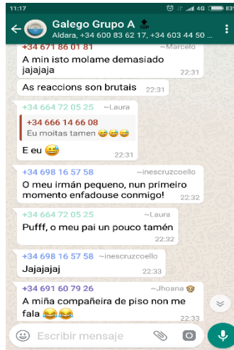
Imaxe 5. Extracto das valoracións das experiencias

En definitiva, concordamos con Cobo & Moravec (2011:26) en que os docentes ensinamos máis do que podemos avaliar e en que non todo o que o alumnado aprende é necesariamente recoñecido como aprendizaxe dentro da educación formal. Con todo, esta experiencia permite verificar que mentres máis ubicuas e diversas sexan as ferramentas que apoian o proceso de ensino-aprendizaxe, máis probábel é que as habilidades e as aprendizaxes invisíbeis para os instrumentos que tradicionalmente miden o coñecemento se poidan tamén constatar; e o certo é que o grupo de whatsapp permite á docente obter un maior volume de información – dificilmente cuantificábel con outro tipo de ferramentas– para valorizar as contribucións do alumnado e o seu grao de compromiso coa materia.