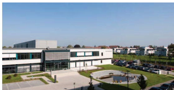
Abbildung 3: WITTENSTEIN bastian (vgl. WITTENSTEIN BASTIAN o. J.)

WITTENSTEIN bastian ist ein Beispiel für eine Ultraeffizienzfabrik in unmittelbarer Nähe zur Wohnnutzung und wird häufig als Referenzbeispiel für das Funktionieren industrieller Produktion in der Stadt herangezogen. Das Unternehmen produziert in Fellbach seit der Fertigstellung der Produktionsstätte im Jahr 2012 Metallerteilfertigung für die Antriebstechnik. WITTENSTEIN bastian ist der Urbanen Industrie zuzuordnen, welche die sogenannten Stadtfabriken umfasst, die traditionellerweise noch im urbanen Raum zu verorten sind oder sich aufgrund neuer Produktionstechnologien wieder in Städten ansiedeln (vgl. BRANDT et al. 2017: 7).