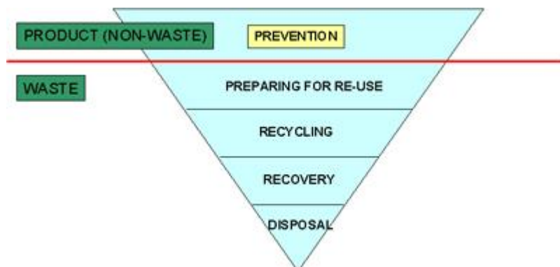
Abbildung 1: Abfallhierarchie

Die folgende Abbildung 1 zeigt die fünfstufige Abfallhierarchie wie sie in Artikel 4 der Abfallrahmenrichtlinie verankert ist: