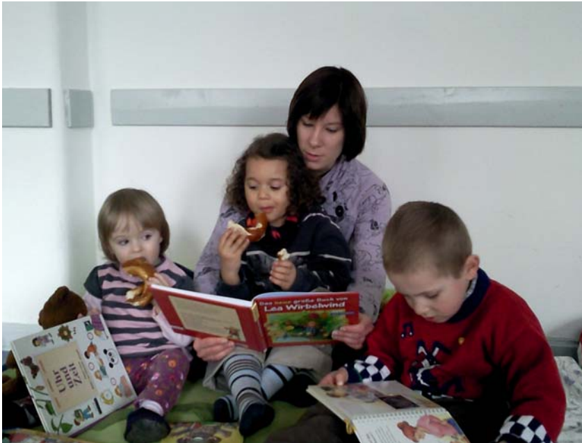
Die jüngsten Tagungsgäste

professionelle Kinderbetreuung bei Konferenzen anbieten. Die Akzeptanz der Kinder, die positiven und oft dankbaren Reaktionen der Eltern sprechen für sich. Ziel soll daher auch sein, dass bei jedem Kongress, jeder Konferenz oder Tagung bei Bedarf eine Kinderbetreuung angeboten wird.