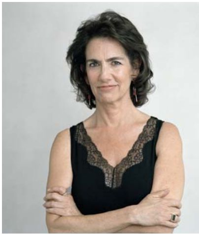
Prof. Dr. Susan Neiman