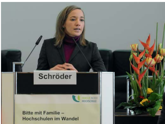
Die jüngste Bundesministerin, Dr. Kristina Schröder, hielt die Eröffnungsrede: „Familienfreundlichkeit ist auch ein Erfolgs- faktor für die Hochschulen“

Großer Bahnhof im Souterrain des Otto-Suhr-Instituts. Punkt 12:00 Uhr trafen dort am 15. März gleich mehrere ICEs ein – wenn auch mit auffallend jungem Zugpersonal: fünf Mädchen und Jungs, angemeldet zur Kongress-Kinderbetreuung. Auf ihren Tretmobilen im Schnellzug-Design kurvten sie zunächst durch den Seminarraum, in dem sie später malten, Ball spielten und bastelten oder ihn verließen, um Dahlemer Spielplätze zu erkunden. Derweil tagten ihre Eltern (hier waren es ausnahmslos Mütter) nebenan im Harnack-Haus. Konferenztitel: „Bitte mit Familie – Hochschulen im Wandel“. So erfuhren sie gleich in Theorie und Praxis, wie sich Studium und wissenschaftliche Karriere mit Elternschaft vereinbaren lassen.