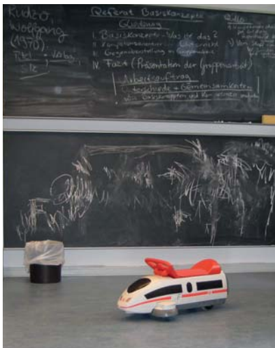
Ein ICE im OSI