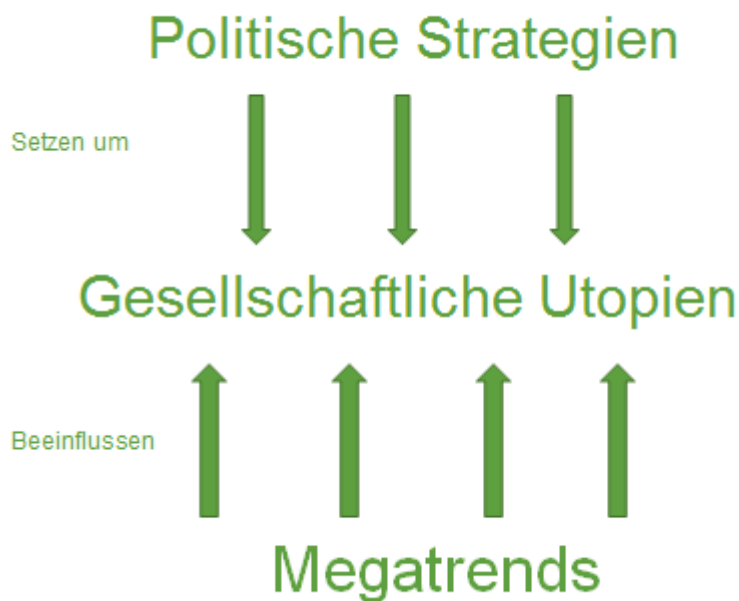
Abbildung 2: Wirkungen zwischen den Umfeldern

Die drei Umfeldern lassen sich also nicht losgelöst von einander betrachten. Aus den Entwicklungen innerhalb der Umfeldern und ihrer Interaktion ergeben sich zahlreiche Fragen, für deren Beantwortung die Akteure der Umfeldern auf die Unterstützung der Wissenschaft angewiesen sind. Im Anschluss wird daher dargestellt, welche Wissensbedarfe sich aus der Umfeldernanalyse für verschiedene Akteure ergeben. Diese bieten einen Anknüpfungspunkt für Forschende, so dass sie gesellschaftliche Wissensbedarfe in ihrer Forschung berücksichtigen können, und können eine Ergänzung zu den bereits identifizierten Wissensbedarfen (durch z.B. Praxispartner) darstellen.