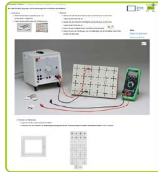
Abb. 2: Beispielseite des interaktiven Lernmoduls

Das IBE wurde gemeinsam mit unterschiedlichen interaktiven Aufgaben in eine Lernumgebung als eSkript eingebettet. Gewählt wurde hier das tet.folio (zu finden unter https://tetfolio.fu-berlin.de ), ein ePortfoliosystem der FUB, das es ermöglicht, alle Elemente ohne großen Aufwand miteinander zu verbinden. In dem so entstandenen interaktiven Lernmodul durchlaufen die Lernenden zunächst zwei Seiten, auf denen sie das Experiment kennenlernen. Dann üben sie die ersten Messungen am Experiment und müssen die Schaltung hinterher im interaktiven Stromlaufplan zusammenbauen. Auf den nächsten beiden Seiten werden die Schaltung komplexer und die Messaufgaben schwieriger. Zur Hilfe gibt es eine Rückmeldung zu den eingetragenen Messwerten und Seiten, auf denen das Messen erklärt wird.