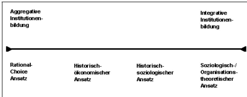
Abbildung 2.1: Einordnung der Varianten des Neo-institutionalismus

Während sich die aggregative Strukturbildung durch die Realisierung von Nutzen erklärt, vollzieht sich die integrative Strukturbildung durch die Befolgung von Normen. Demzufolge wird, idealtypisch, die ökonomische Variante des 'Rational-Choice' Institutionalismus dem aggregativen Endpunkt des Kontinuums 14 , die 'soziologische'- beziehungsweise 'organisationstheoretische' Variante des Institutionalismus dem integrativen Ende zugewiesen. Darüber hinaus werden mit dem 'historisch-ökonomischen' sowie dem 'historisch-soziologischen' Institutionalismus zwei Ansätze zwischen den beiden Polen platziert, die zum Teil erhebliche Berührungspunkte aufweisen. Ausgehend von der Darstellung der vier neo-institutionalistischen Ansätze wird im folgenden (vgl. 4) eine Gegenüberstellung der Varianten präsentiert, aus welcher einige der Arbeit zugrundeliegende Annahmen bezüglich der fünf oben genannten Kategorien abgeleitet werden. Darauf hin (vgl. 5) wird auf der Grundlage dieser Annahmen ein Analyseraster entworfen, welches das Kernargument sowie den Fortgang der Arbeit beschreibt.