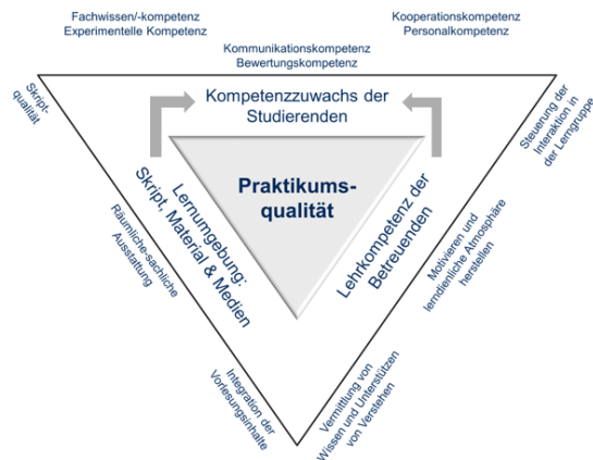
Abb. 1: Theoretisches 3L-Modell der Praktikumsqualität in drei Hauptdimensionen: Kompetenzzuwachs (Lernerfolg), Lehrkompetenz und Lernumgebung. Letztere zwei wirken hypothetisch auf ersteres ein.

Mit der literaturgestützten Erarbeitung eines theoretischen Modells der Praktikumsqualität fand für die Erfassung von praktikumsrelevanten Facetten der erste Schritt statt (Abb. 1). Das 3L-Modell definiert als Qualitätsdimensionen den Lernzuwachs als Kompetenzerwerb der Studierenden, die didaktische und pädagogische Lehrkompetenz der Betreuenden und die Lernumgebung von Praktika [9].