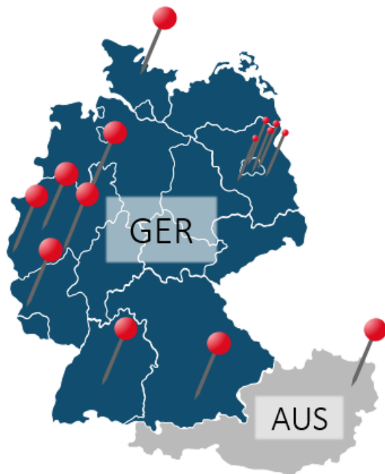
Abb. 2: Standorte der Praktika, in denen die Erhebungen für FF3 stattfanden (Bildquelle: Quickslide, Strategy Compass GmbH).

Für die Erhebung wurde eine Stichprobengröße von N > 250 je Fragebogentyp angestrebt.