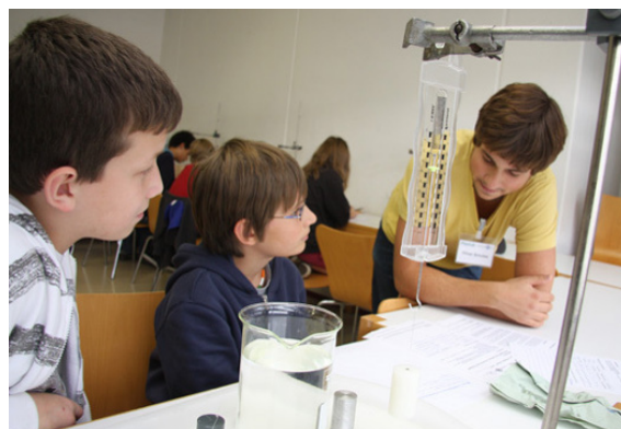
Abb. 3: Betreuer und Schüler an einer Experimentierstation

Die (kognitive) Aktivierung der Teilnehmer_innen ist insgesamt sehr hoch, da sie sich in den Einführungsveranstaltungen die entsprechenden Inhalte selbst erarbeiten, täglich zweimal Schüler_innen an den Experimentierstationen betreuen und in den Einführungs- bzw. Auswertungsphasen (MUS) entweder selbst die Sitzungsleitung innehaben oder während der Hospitationen ihren Beobachtungsaufgaben nachgehen.