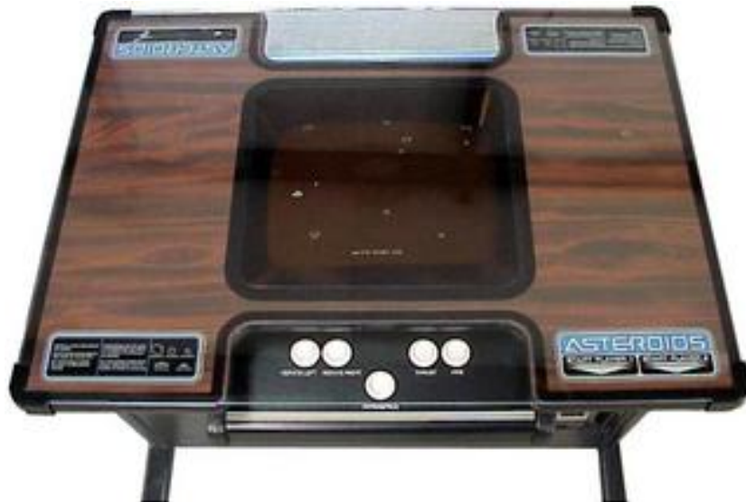
Abbildung 1. Original-Konsole des Spiels Asteroids (Abbildung aus [6])

Einheiten, welche auch zufällige Flugbahnen beginnend beim Abschussort einnehmen. Für jeden Abschuss erhält der Spieler Punkte (siehe Abbildung 2).