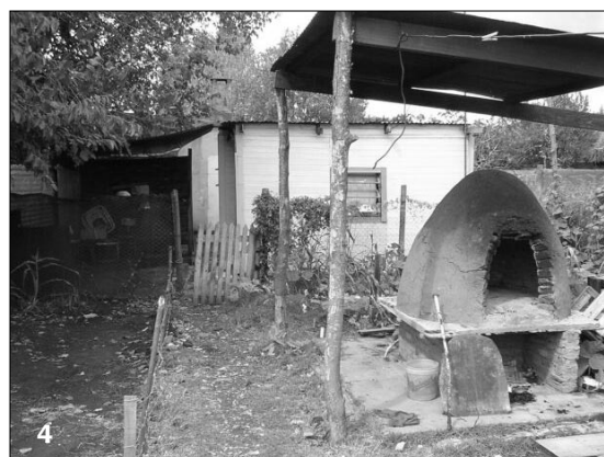
1. Frente de casa de S. y pasillo de acceso. 2. Patio y fondo del terreno 3. Entrada al comedor por detrás. 4. Horno de barro, casa de la hija.

tio con baldosas, al que sigue una huerta, un horno de barro y al final del terreno, una casita donde vive una de las hijas de S. Todo en unos 50 metros de largo por unos 12 de ancho.