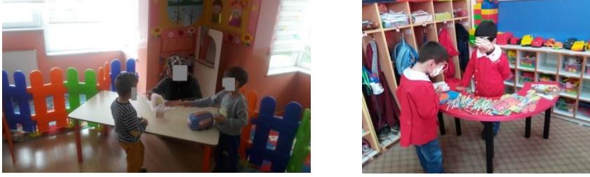
Resim 1. Çalışmada Kullanılan Oyuncakçı ve Kırtasiye Mağazaları

Drama uygulaması esnasında ve sonrasında çocuklarla yapılan mülakatlar neticesinde çocukların pazarlama kavramlarına yönelik bilinç düzeyi belirlenmeye çalışılmıştır. Çocuklarla gerçekleştirilen mülakatlarda 5 Tablo:2, Tablo:4 ve Tablo:5’te yer verilen kavramlara yönelik çocukların bilgi düzeylerinin ölçülmesi amaçlanmış, bu amaçla çocukların bu kavramları bilme düzeylerini anlamak için çocuklara doğrudan “..... nedir?” gibi sorular sormak yerine, soruların çocukların yaşlarına uygun olacak biçimde çalışma kapsamında elde edilmeye çalışılan bilgiye verebileceği şekle dönüştürülerek, bir başka ifade ile çocuğun dünyasına hitap edebilecek (bazen dolaylı, bazen de oyuna dönüştürerek vb.) şekle dönüştürülerek sorulması tercih edilmiştir. Çalışmada kullanılan mülakat soruları EK-1’de verilmiştir. Mülakat sorularında (1,2,3,4,5,6,8,11,13,17,19, 20,21,22,23,24,25,26,27 ve 28. soru) Bulut vd. (2014)’ten yararlanılmış, (7, 9,10,12,14,15,16,18,29,30,31,33,34,35 ve 36. soru) sorular ise çalışmanın araştırmacıları tarafından oluşturulmuştur.