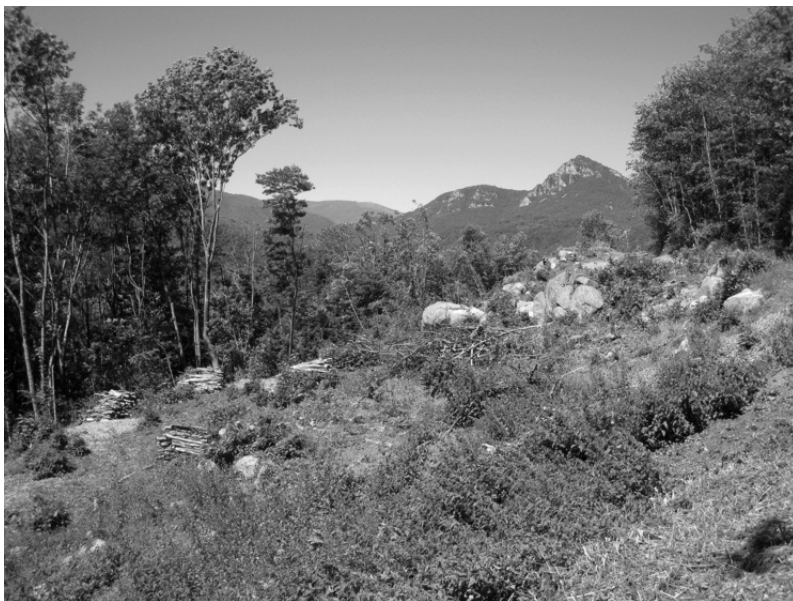
Photo 5 : Vue de la châtaigneraie du Vallespir : coupe au premier plan.

programme d'ampleur de Restauration des terrains en montagne (RTM) a alors été mis en place, avec la plantation de 10 000 hectares en résineux (pin laricio, mélèze, cèdre, épicéa). Mises à part ces plantations RTM constituant les forêts domaniales, une forêt départementale de 200 hectares gérée par l'Office national des forêts (ONF), et quelques petites forêts communales de 50 à 200 hectares attachées à des mas, tout le reste du massif (90%) appartient à des propriétaires privés.