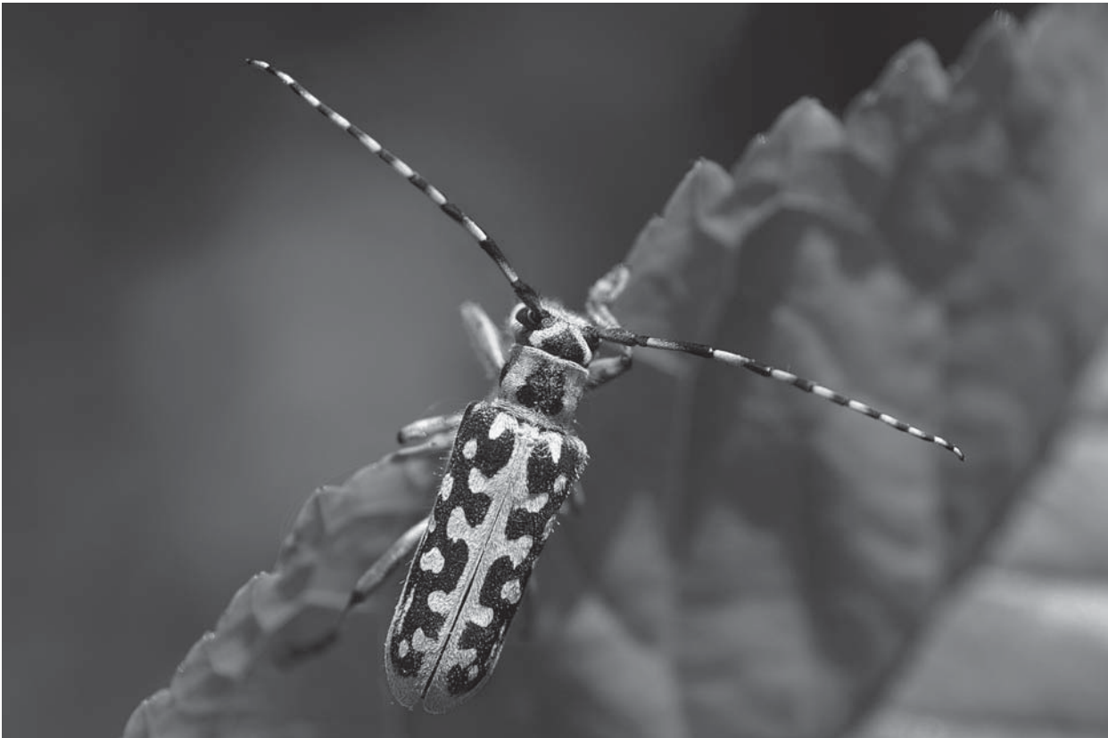
Saperda scalaris - Taille réelle : 15 mm (la taille est toujours celle du corps, hors antennes)