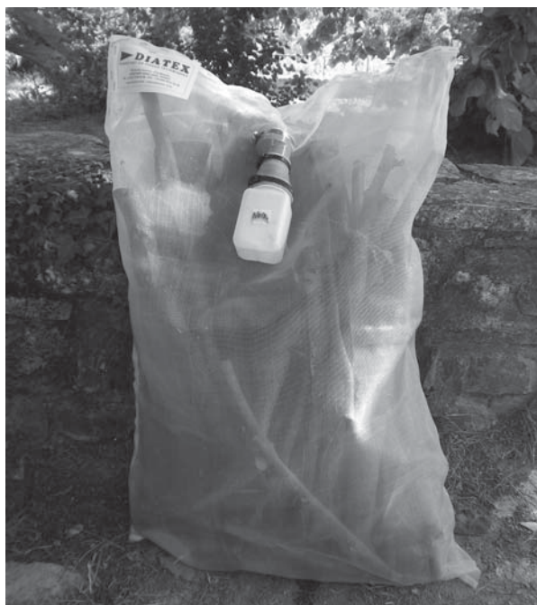
Nasse d'émergence

Le référentiel taxonomique utilisé est celui de l'Inventaire national du patrimoine naturel (INPN) actualisé en novembre 2016 (Taxref v10.0), téléchargeable sur le site de l'INPN.