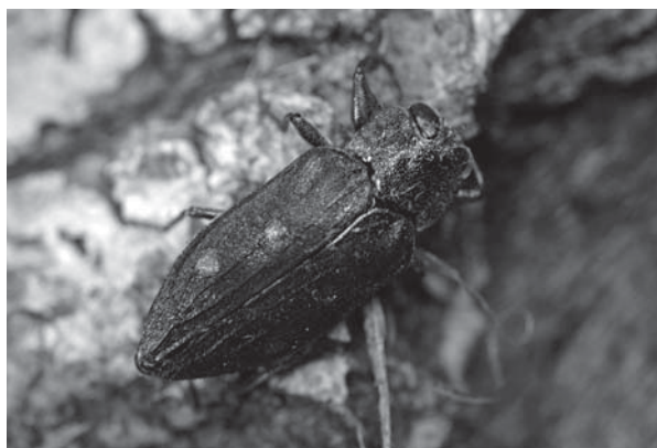
Chrysobothris affinis - Taille réelle : 13 mm - Fred Chevaillot

Largement répandu dans la plus grande partie de l'Europe, ce bupreste est considéré comme polyphage sur un grand nombre de feuillus (les autres espèces françaises du genre sont liées aux conifères). Les auteurs citent les principales essences fruitières, dont le Pommier, mais pas le Noisetier. L'adulte est donné comme visible d'avril à septembre.