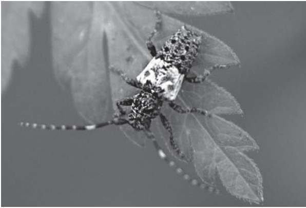
Pogonocherus hispidulus - Taille réelle : 6 mm