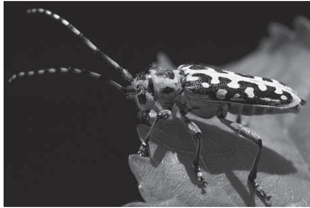
Saperda scalaris - Taille réelle : 15 mm - Photo : Henri Maleysson

Saperda scalaris (Linnaeus, 1758) – (35 individus issus du Cerisier, entre février et juin 2014)