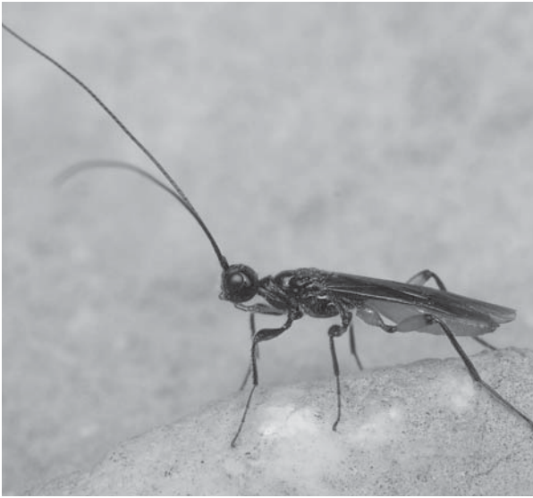
Doryctes leucogaster - Taille réelle : 6,5 mm - Photo : Pierre Gros

Anobiidae, Bostrichidae) ainsi que quelques données douteuses sur Cleridae, Chrysomelidae et lépidoptères. Il n'existe pas de donnée bibliographique liant ce parasitoïde au Pommier mais il est relativement polyphage et ses hôtes attaquent eux-mêmes une large variété d'arbres. Les émergences de D. leucogaster ont été obtenues sur des échantillons largement infestés par Chrysobothris affinis qui en est donc l'hôte présumé. Cette espèce n'est pas citée dans la gamme d'hôte mais D. leucogaster a été signalé en Italie sur C. solieri Gory & Laporte, 1837 (Campadelli & Scaramozzino, 1994). Comme la précédente, c'est un ectoparasitoïde idiobionte. Le grand nombre d'émergences s'explique par le comportement grégaire des femelles, de nombreux œufs étant pondus sur le même hôte.