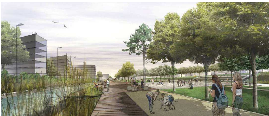
Perspective du Ru d'Orgeval remis à ciel ouvert au sein du Parc Molière

De par la nature même du projet, l'imperméabilisation des sols est limitée, notamment par la démolition de bâtiments. La réouverture du Ru d'Orgeval sera réalisée de manière naturelle par compaction des argiles. De plus, un travail sur la qualité des eaux du Ru a été effectué avec la mise en place d'un jardin filtrant. En conséquence, la présence d'eau dans le projet affirme de manière paysagère le souhait de créer un espace de tranquillité et de repos favorable à l'amélioration du cadre de vie.