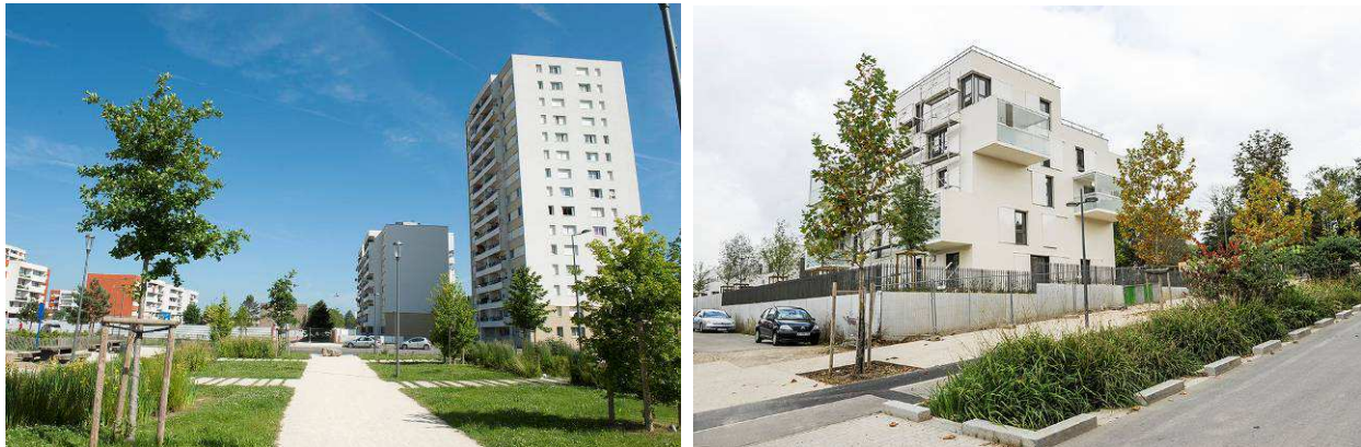
Exemples de réalisations (noues)

but, le Ru d'Orgeval sera mis en scène dans le Parc Molière, avec une promenade prévue tout le long, et des aménagements paysagers de qualité pour le mettre en valeur.